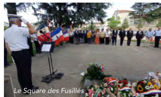
Le Square des Fusillés

C'est une cérémonie inhabituelle qui se tiendra lundi 13 avril, à 17 h, au Square des Fusillés de Portes-lès-Valence. 96 élèves gendarmes vont défilé en chanson dans les rues de Portes-lès-Valence, pour se rendre au Square des Fusillés. Sur place, ils rendront hommage au gen-