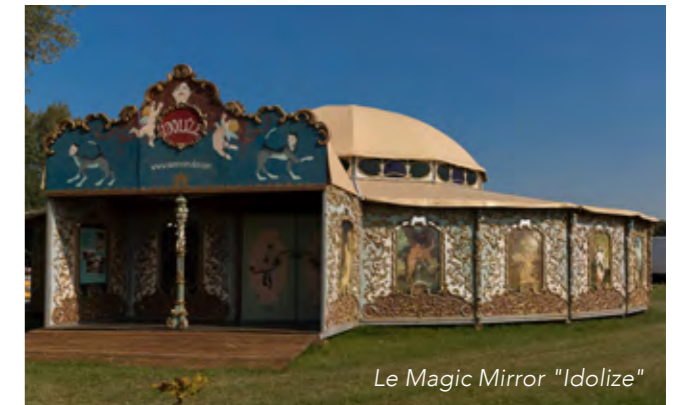
Le Magic Mirror "Idolize"

Le Magic Mirror "Idolize", s'érigera majestueusement au parc Léo Lagrange courant avril. Est-ce un cirque, un cabaret baroque, un chapiteau en bois, un dôme singulier ? C'est tout cela à la fois, avec la convivialité et la magie du décor en plus !