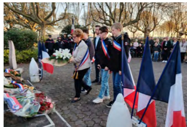
La cérémonie a eu lieu en présence des représentants des associations patriotiques, des élus du conseil municipal et du Conseil Municipal des Jeunes et du président du conseil départemental.

ou inconnues, de la guerre d'Algérie et des combats en Tunisie et au Maroc. » Cet hommage a pris toute sa valeur au moment du dépôt de gerbes au nom de la FNACA de Portes-lès-Valence, du Comité d'entente des anciens combattants, du Souvenir français, du Conseil municipal, accompagné par le Conseil Municipal des Jeunes et du Conseil départemental, au pied du monument aux morts.