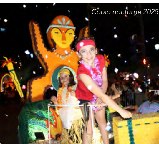
Corso nocturne 2025