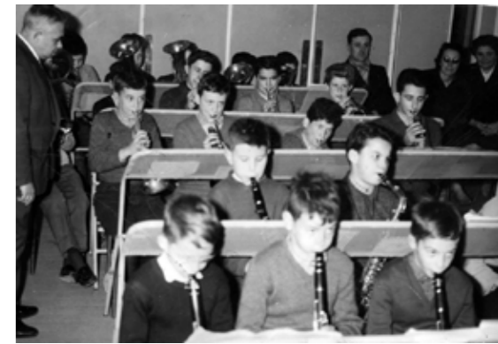
La section musique des Amis de l'École Laïque, en 1962.