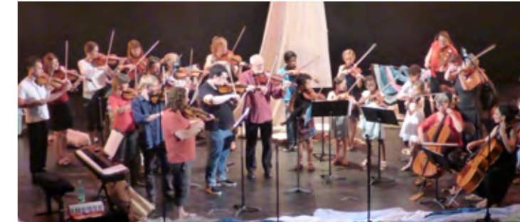
Le Conte musical est un des temps forts de l'année.

actions en direction des jeunes publics, notamment en partenariat avec les établissements scolaires. Découvertes musicales, interventions en milieu scolaire à l'image de l'école Joliot-Curie dans quelques semaines et événements rythment l'année, comme le Conte musical ou le Concert de printemps.