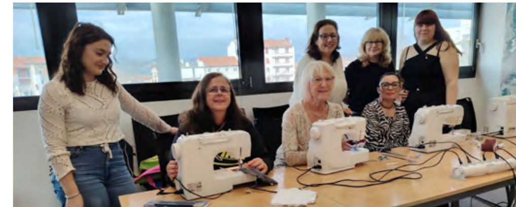
Pour les participantes, l'atelier couture est aussi une occasion de rencontrer d'autres personnes.

du lien est vraiment important » renchérit Cathy. Deux heures plus tard, les 4 apprenties sont reparties avec leurs œuvres sous le bras et avec le souvenir d'un moment agréable.