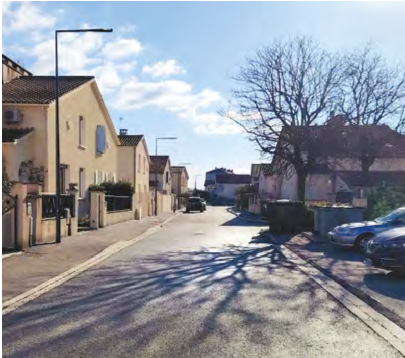
La rue Gérard Philipe avant et maintenant, après 2 mois de travaux et un investissement de 290 000 € HT.