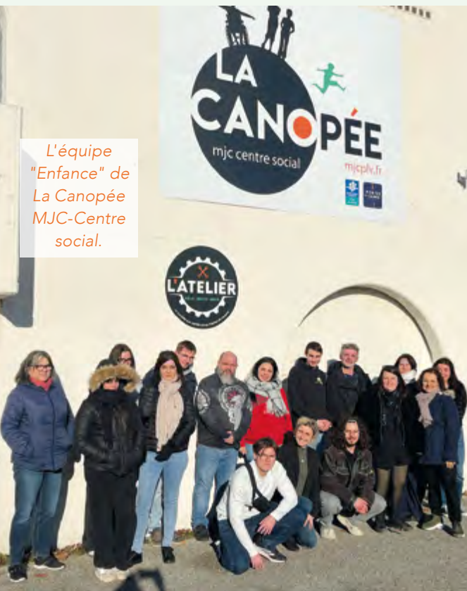
L'équipe "Enfance" de La Canopée MJC-Centre social.

À La Canopée, l'objectif est de permettre à chaque enfant de grandir et de s'épanouir à son rythme et de répondre aux besoins des familles.