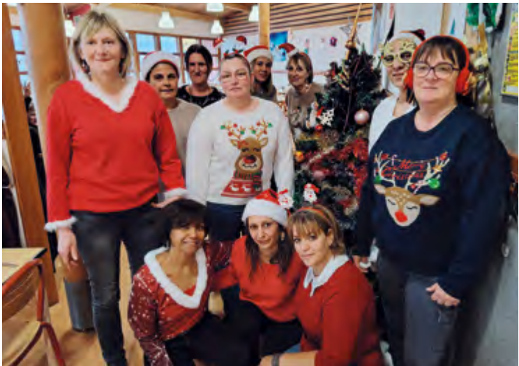
LE REPAS DE NOËL DES RESTAURANTS SCOLAIRES Une salade agrémentée de dés de fromage, une aiguillette de canard à la châtaigne ou une galette de sarrasin, du gratin dauphinois, un yaourt à boire et un donut. Jeudi 18 décembre, le menu de Noël a été particulièrement apprécié par les 500 enfants qui, chaque jour, mangent dans les 4 restaurants scolaires de la ville. Coup de chapeau au personnel qui avait décoré les salles et s'était déguisé pour l'occasion.