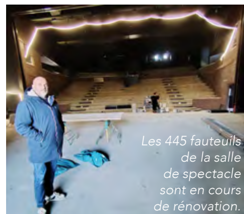
Les 445 fauteuils de la salle de spectacle sont en cours de rénovation.

du parking et du parvis est bien prévue, mais elle interviendra dans un second temps, à l'horizon 2027. Si les équipes du Train Théâtre réintégreront les lieux au mois d'avril, c'est dans un équipement modernisé et prêt à relever les défis des prochaines décennies que s'ouvrira, en octobre, la saison culturelle 2026-2027. Un nouveau chapitre s'annonce pour ce lieu emblématique de Portes-lès-Valence.