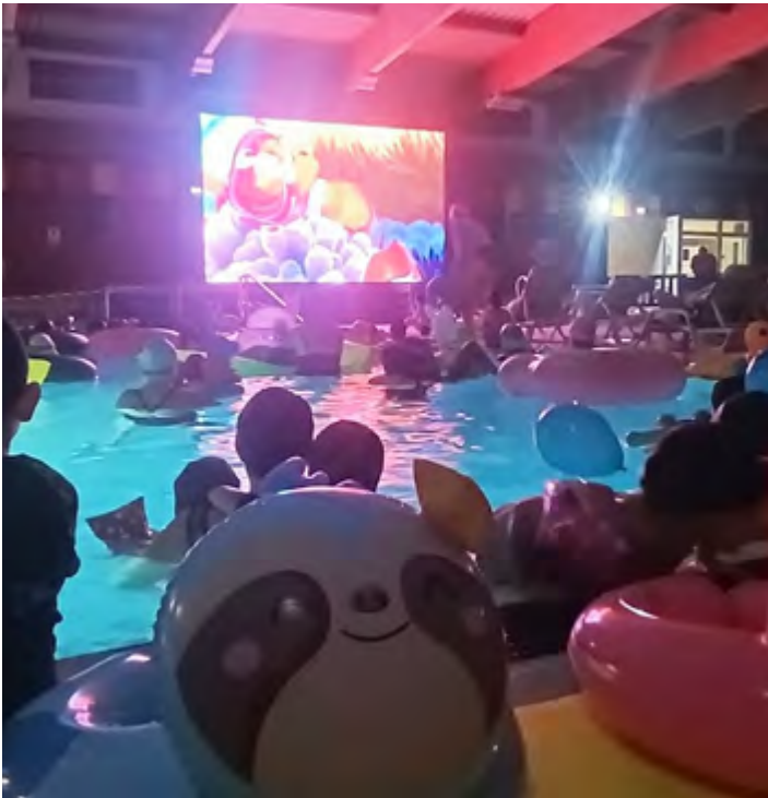
AQUACINÉ À LA PISCINE CAMILLE MUFFAT C'était une première ! Samedi 20 décembre, Valence Romans Agglo a proposé un aquaciné à la piscine Camille Muffat. Ils étaient nombreux à regarder Le Monde de Nemo sur un écran géant, en maillot, sur une bouée et dans une eau à 32°C !