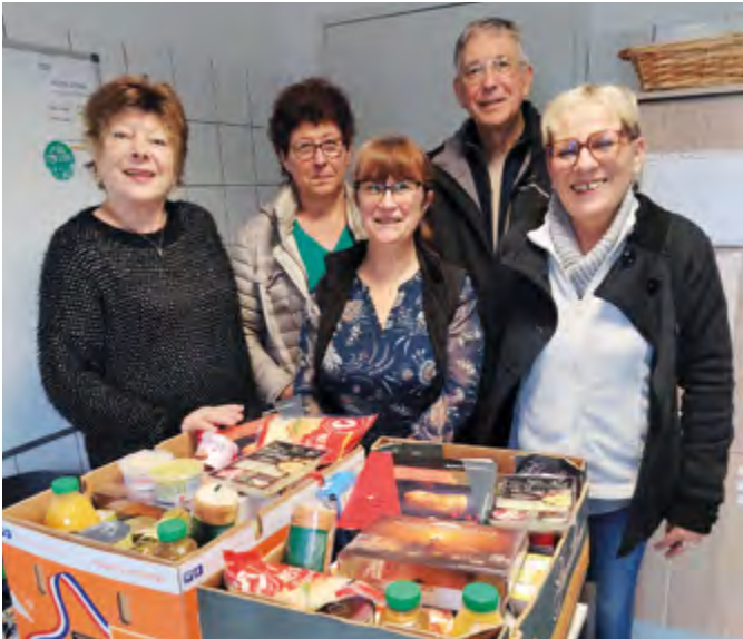
DISTRIBUTION DES COLIS SOLIDAIRES À Portes-lès-Valence, la solidarité n'est pas un vain mot. Mardi 16 décembre avait lieu la distribution des colis solidaires. D'une valeur d'un peu plus de 75€ par personne, ils sont destinés aux familles en difficulté et aux personnes aux revenus modestes inscrites auprès du CCAS.