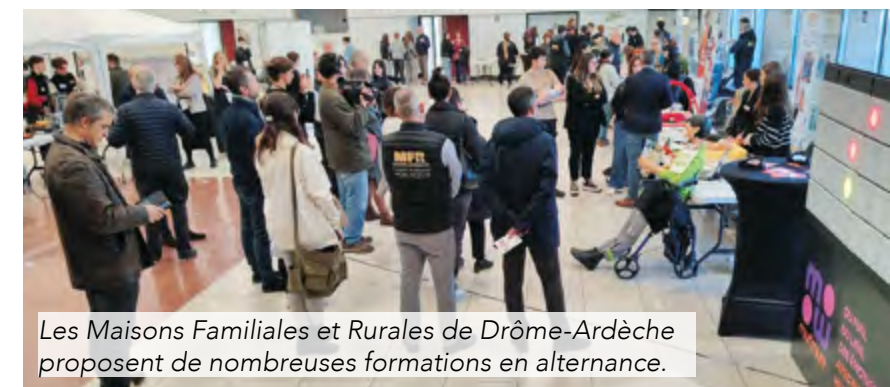
Les Maisons Familiales et Rurales de Drôme-Ardèche proposent de nombreuses formations en alternance.