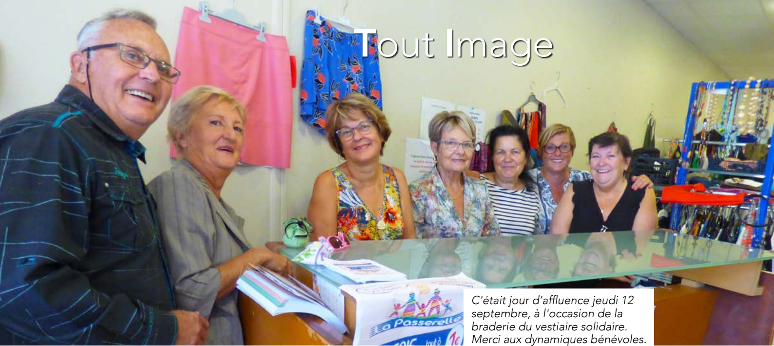
C'était jour d'affluence jeudi 12 septembre, à l'occasion de la braderie du vestiaire solidaire. Merci aux dynamiques bénévoles.