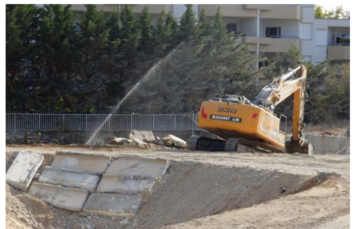
Adieu l'ancienne gendarmerie ! Les engins de chantier ont terminé la destruction du bâtiment de la rue Jean Jaurès. 33 appartements qui formeront le "Clos Jaurès" vont prochainement voir le jour.