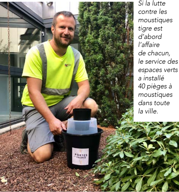
Si la lutte contre les moustiques tigre est d'abord l'affaire de chacun, le service des espaces verts a installé 40 pièges à moustiques dans toute la ville.