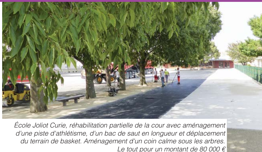
École Joliot Curie, réhabilitation partielle de la cour avec aménagement d'une piste d'athlétisme, d'un bac de saut en longueur et déplacement du terrain de basket. Aménagement d'un coin calme sous les arbres. Le tout pour un montant de 80 000 €