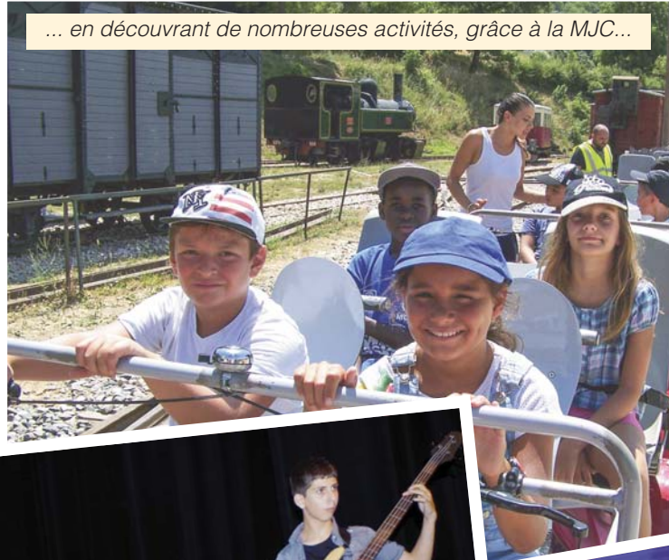
... en découvrant de nombreuses activités, grâce à la MJC...