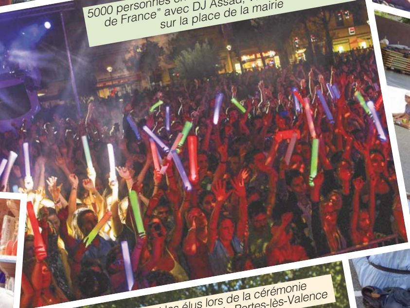
5000 personnes en folie pour le "Plus grand before de France" avec DJ Assad, vendredi 28 août sur la place de la mairie