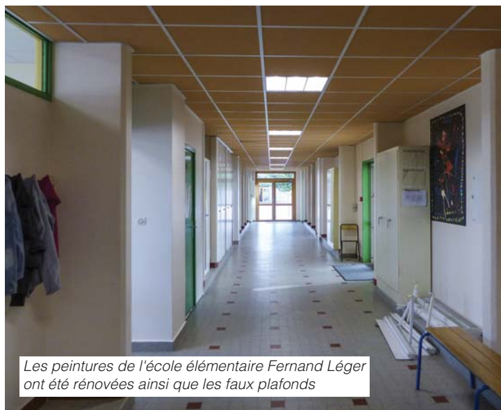
Les peintures de l'école élémentaire Fernand Léger ont été rénovées ainsi que les faux plafonds

L'ensemble scolaire Voltaire (les 4 photos en bas de page) a bénéficié de beaucoup de rénovations. Un nouveau portail électrique (photo ci-contre) a été installé pour garantir la sécurité des enfants de ces deux écoles. Dorénavant, tous les visiteurs devront s'identifier à la caméra du portail avant d'entrer. Les services techniques ont remis aux normes l'électricité, pour améliorer le réseau informatique. De nombreuses classes ont été repeintes et les faux plafonds remis à neuf.