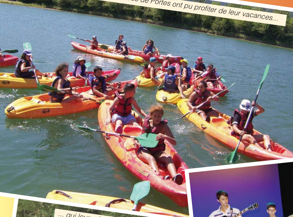
Les enfants et les ados de Portes ont pu profiter de leur vacances...