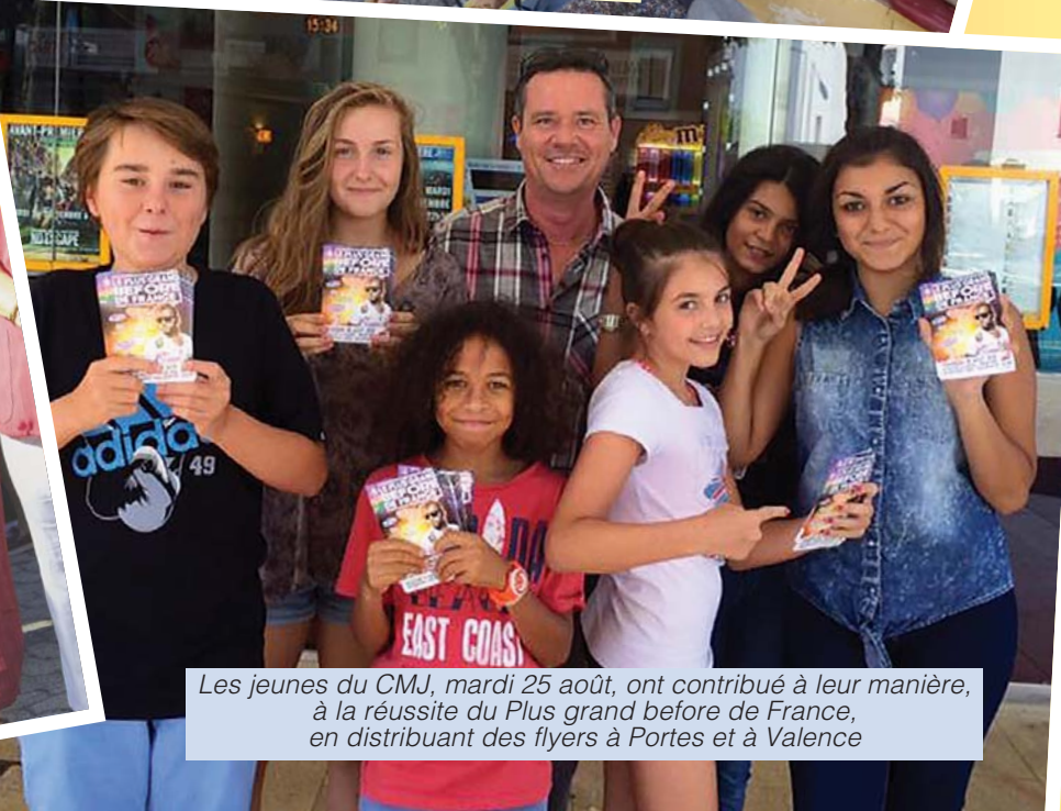
Les jeunes du CMJ, mardi 25 août, ont contribué à leur manière, à la réussite du Plus grand before de France, en distribuant des flyers à Portes et à Valence