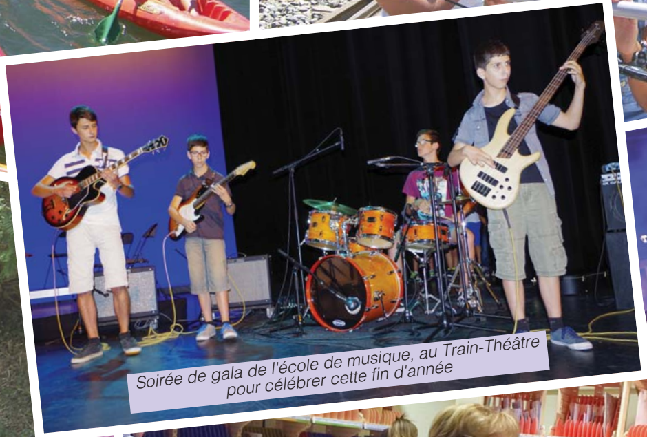
Soirée de gala de l'école de musique, au Train-Théâtre pour célébrer cette fin d'année