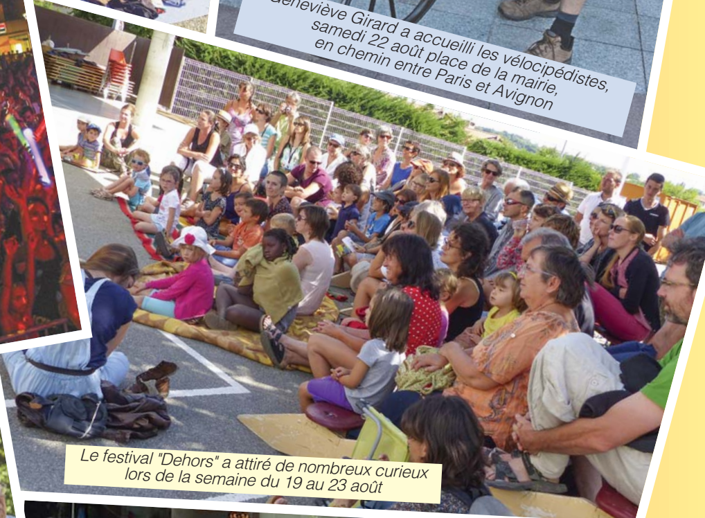
Le festival "Dehors" a attiré de nombreux curieux lors de la semaine du 19 au 23 août