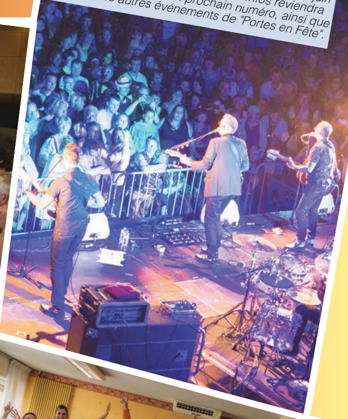
Grand concert de Michael Jones, dimanche 21 juin pour la fête de la musique. Portes-Infos reviendra sur ce concert dans son prochain numéro, ainsi que sur tous les autres événements de "Portes en Fête".