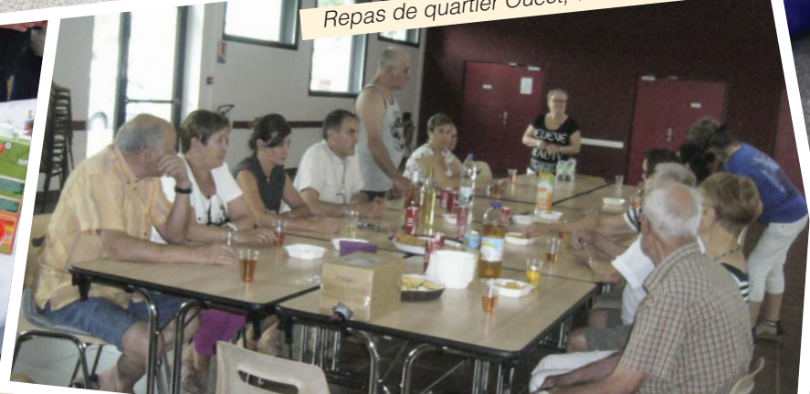
Repas de quartier Ouest, vendredi 5 juin