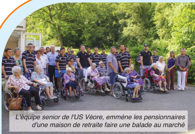
L'équipe senior de l'US Véore, emmène les pensionnaires d'une maison de retraite faire une balade au marché