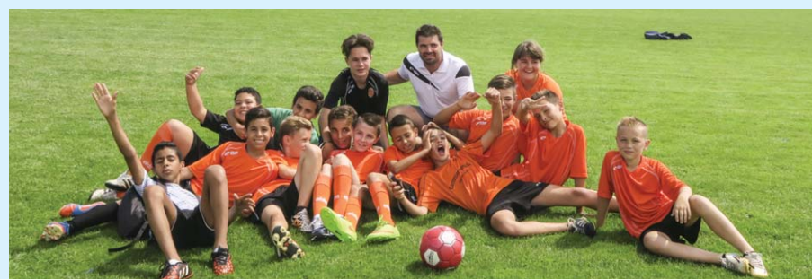
... La relève est assurée par la nouvelle génération de Football Portois, ici l'équipe des minimes.