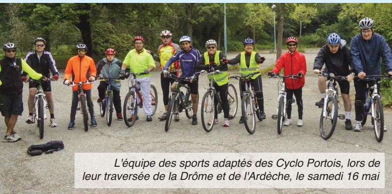
L'équipe des sports adaptés des Cyclo Portois, lors de leur traversée de la Drôme et de l'Ardèche, le samedi 16 mai