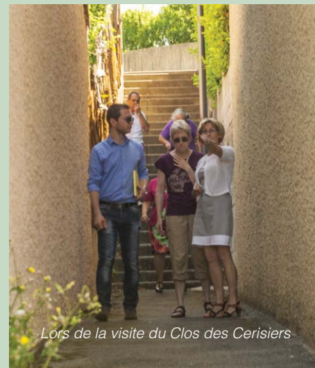
Lors de la visite du Clos des Cerisiers