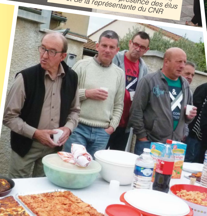
Repas du quartier Le Peyrollet, vendredi 29 mai