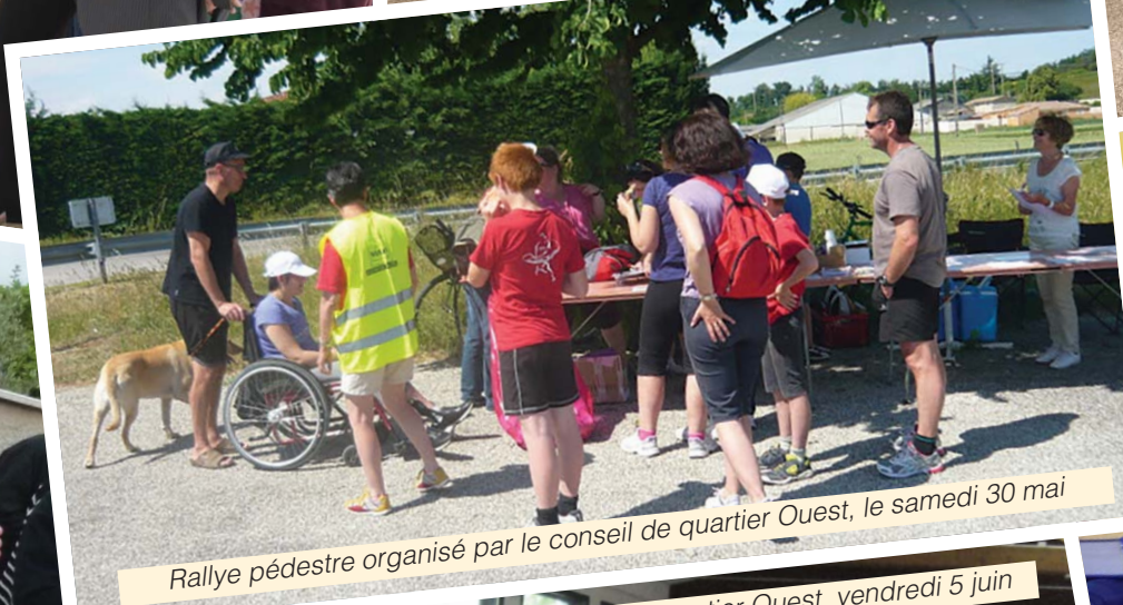
Rallye pédestre organisé par le conseil de quartier Ouest, le samedi 30 mai