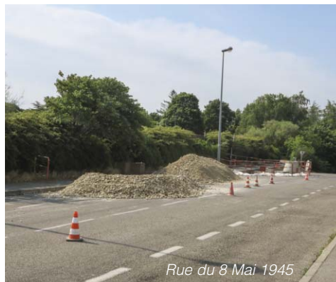
Rue du 8 Mai 1945