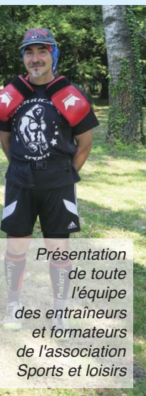
Présentation de toute l'équipe des entraîneurs et formateurs de l'association Sports et loisirs