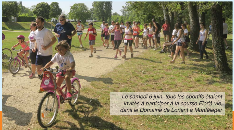
Le samedi 6 juin, tous les sportifs étaient invités à participer à la course Flor'à vie, dans le Domaine de Lorient à Montléger