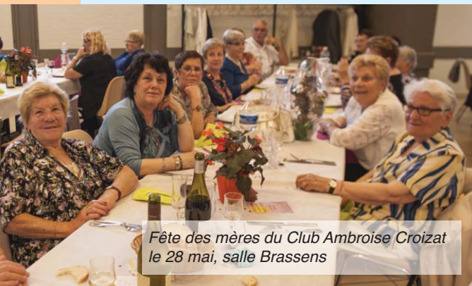
Fête des mères du Club Ambroise Croizat le 28 mai, salle Brassens