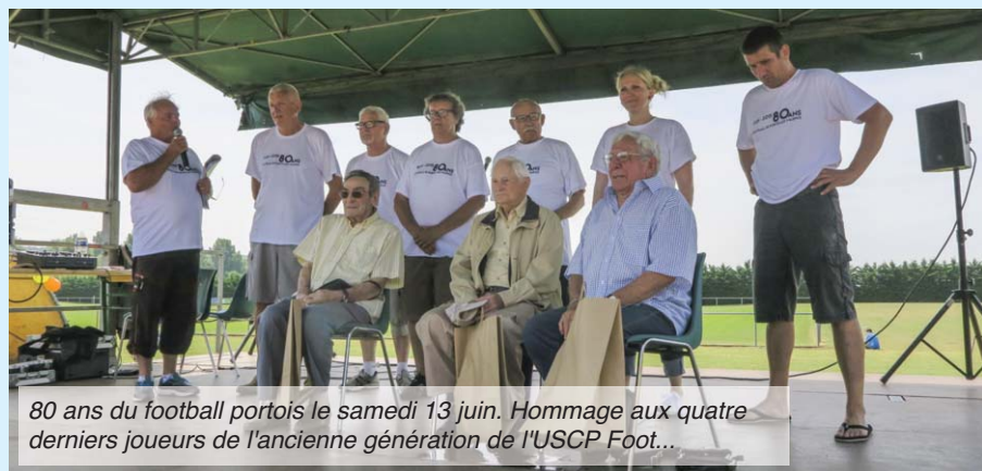
80 ans du football portois le samedi 13 juin. Hommage aux quatre derniers joueurs de l'ancienne génération de l'USCP Foot...