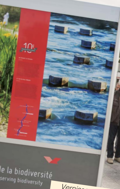
Vernissage de l'exposition du CNR, le samedi 23 mai en présence des élus et de la représentante du CNR