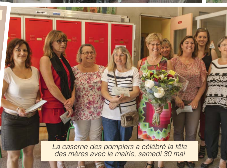
La caserne des pompiers a célébré la fête des mères avec le mairie, samedi 30 mai