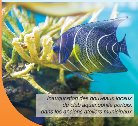
Inauguration des nouveaux locaux du club aquariophile portoises, dans les anciens ateliers municipaux