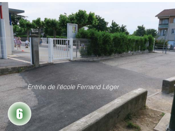
Entrée de l'école Fernand Léger