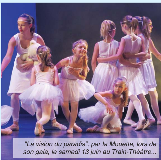
"La vision du paradis", par la Mouette, lors de son gala, le samedi 13 juin au Train-Théâtre...