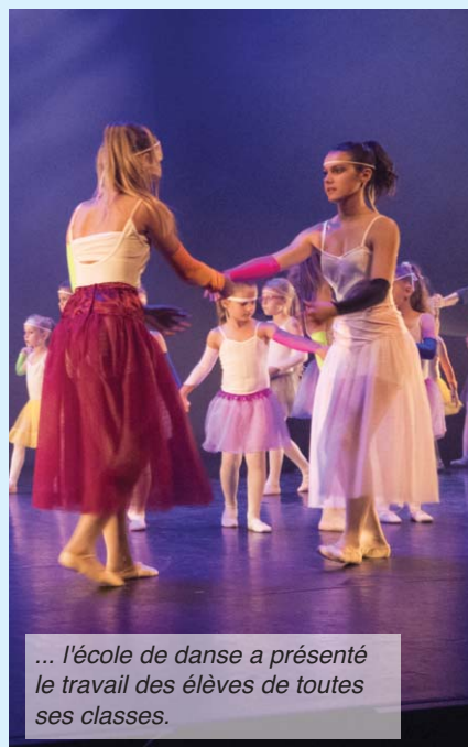
... l'école de danse a présenté le travail des élèves de toutes ses classes.