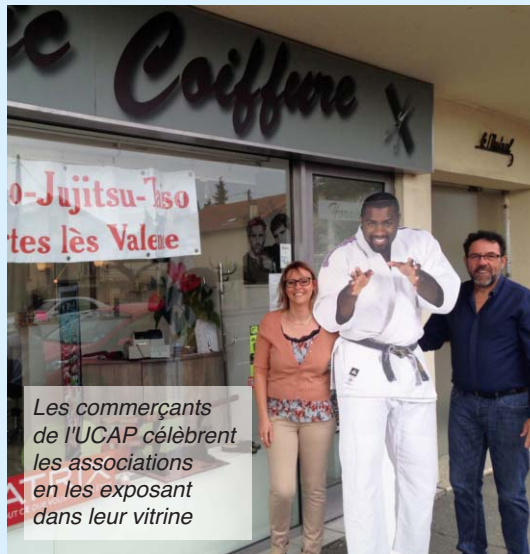
Les commerçants de l'UCAP célèbrent les associations en les exposant dans leur vitrine