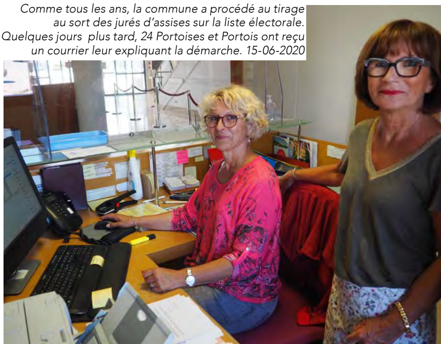
Comme tous les ans, la commune a procédé au tirage au sort des jurés d'assise sur la liste électorale. Quelques jours plus tard, 24 Portoises et Portoises ont reçu un courrier leur expliquant la démarche. 15-06-2020