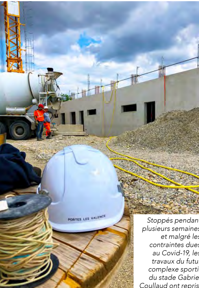
Stoppés pendant plusieurs semaines et malgré les contraintes dues au Covid-19, les travaux du futur complexe sportif du stade Gabriel Coullaud ont repris.