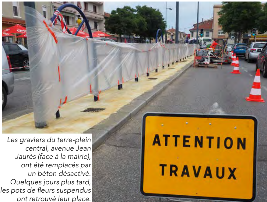
Les graviers du terre-plein central, avenue Jean Jaurès (face à la mairie), ont été remplacés par un béton désactivé. Quelques jours plus tard, les pots de fleurs suspendus ont retrouvé leur place.