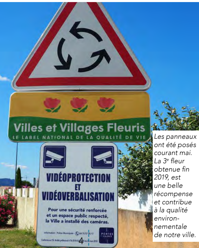
Les panneaux ont été posés courant mai. La 3 e fleur obtenue fin 2019, est une belle récompense et contribue à la qualité environnementale de notre ville.