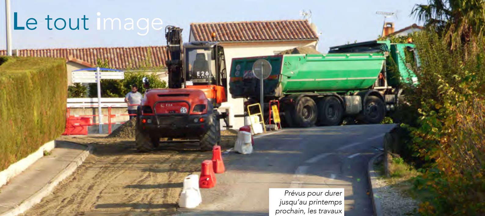
Prévus pour durer jusqu'au printemps prochain, les travaux de la rue Casanova viennent de démarrer (lire en page 8).