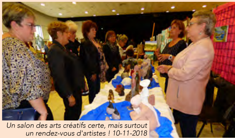
Un salon des arts créatifs certes, mais surtout un rendez-vous d'artistes ! 10-11-2018