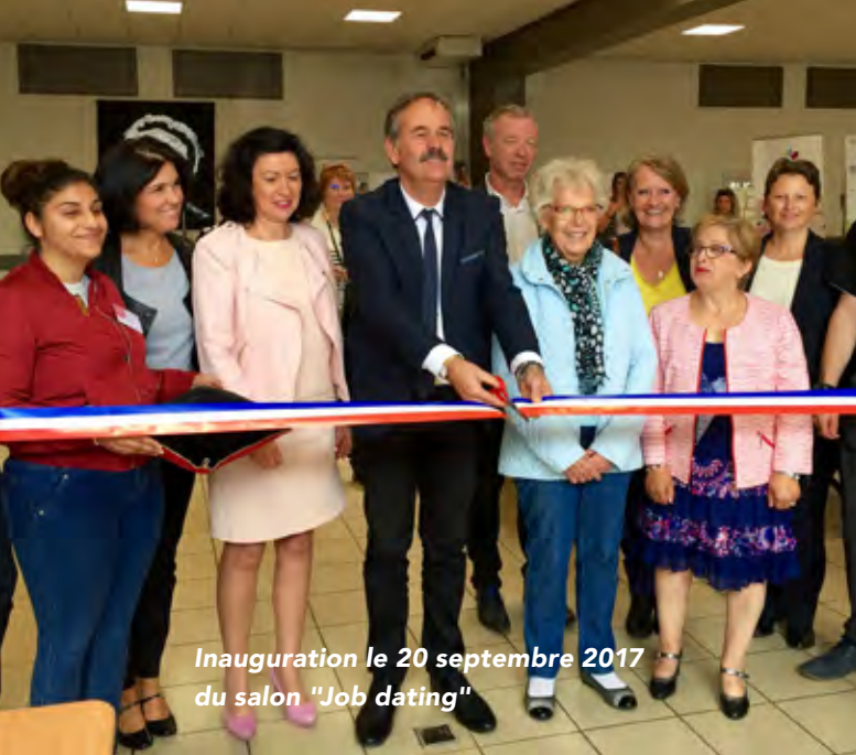
Inauguration le 20 septembre 2017 du salon "Job dating"

L'économie, c'est aussi les structures de taille moyenne et les petits commerces. Comment arrivez-vous à maintenir les équilibres et surtout à vitaliser le centre-ville ?