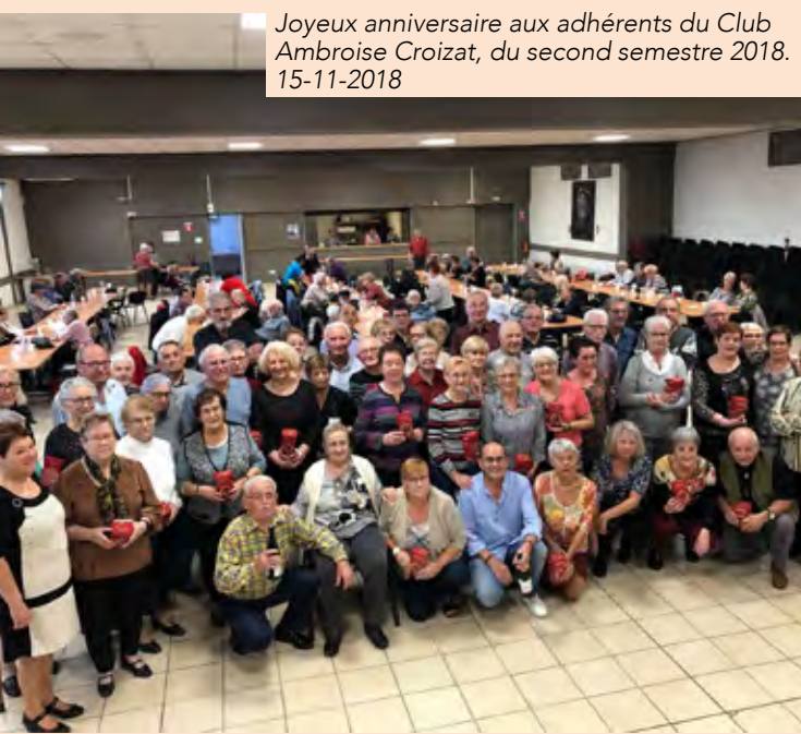
Joyeux anniversaire aux adhérents du Club Ambroise Croizat, du second semestre 2018. 15-11-2018