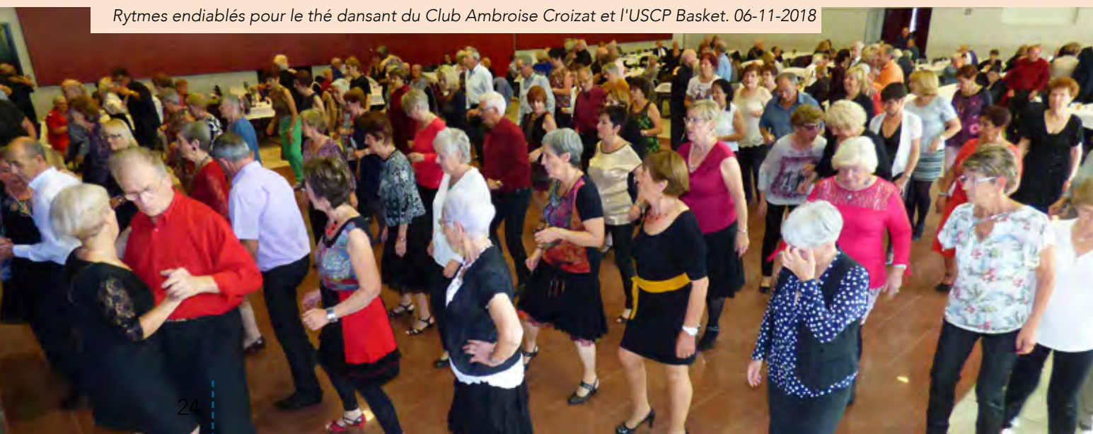
Rytmes endiablés pour le thé dansant du Club Ambroise Croizat et l'USCP Basket. 06-11-2018