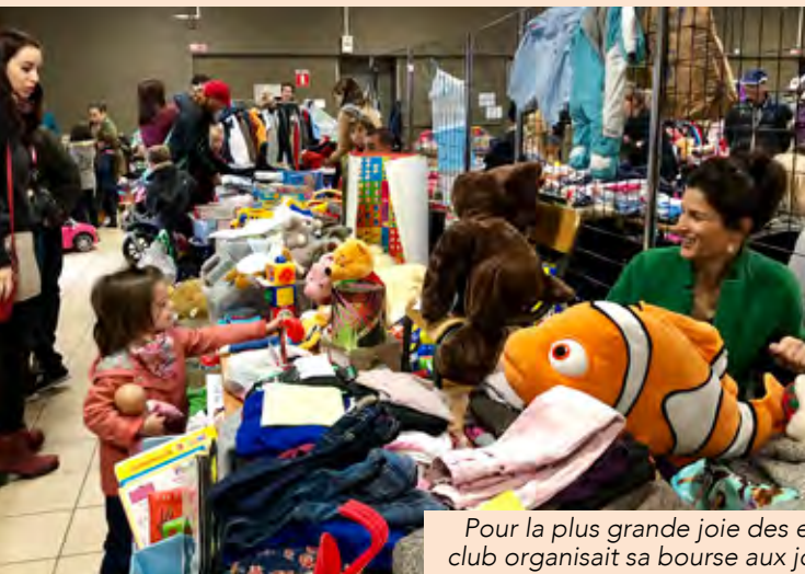
Pour la plus grande joie des enfants le Twirling club organisait sa bourse aux jouets. 05-11-2018