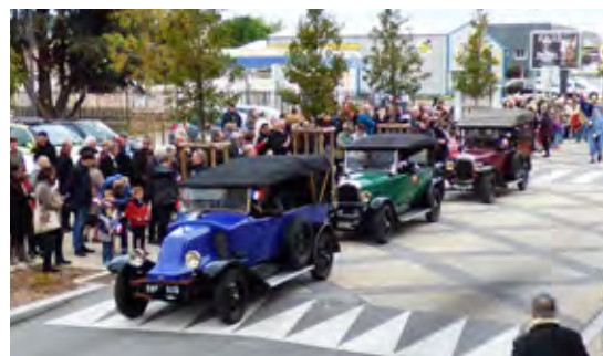
Honneur à nos Poilus, mais aussi à l'Écurie Mistral avec son défilé de voitures d'époque. 11-11-2018

Retour vers le passé Située à l'entrée Nord de la ville, presque en face de la Maison des associations, la Villa Marie Rose (photo de 1920) est l'un des plus vieux bâtiments de Portes. Maison bourgeoise, elle était réservée au chef de dépôt Snf.