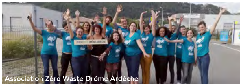
Association Zéro Waste Drôme Ardèche

Samedi 15 décembre de 15h à 19h, la MJC-Centre social vous propose un après-midi 100% fait maison dans le Centre culturel Louis Aragon. Des stands de fabrication d'objets multiples en matériaux de récupération (perles, cartes de Noël, bijoux, boîtes à secrets ou à malice...), des ateliers de cuisine végétarienne, une exposition antigaspil alimentaire, un concours