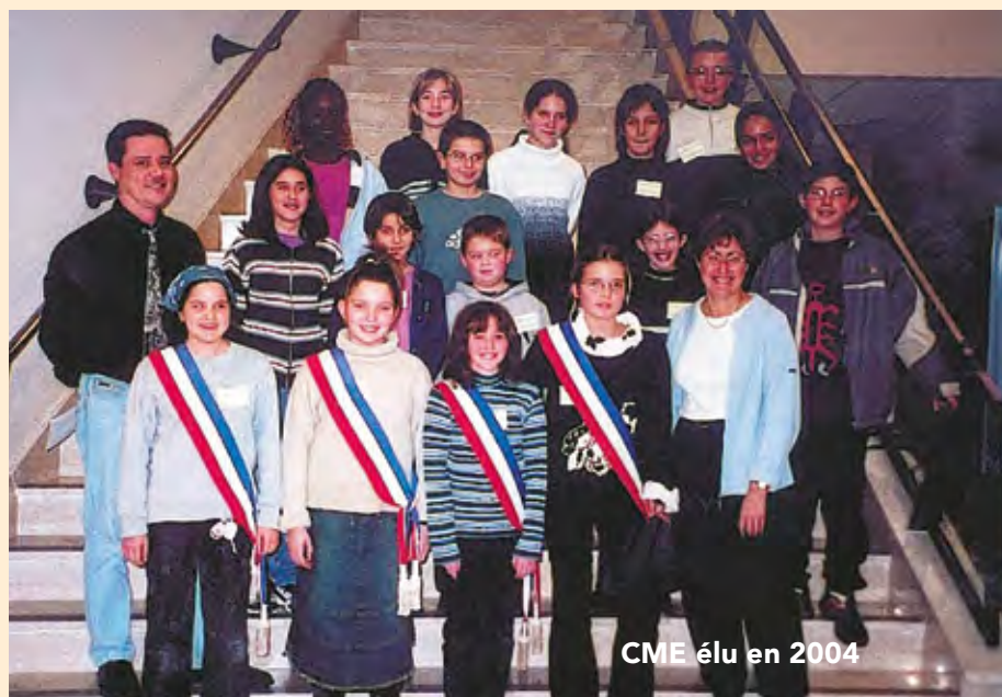
CME élu en 2004