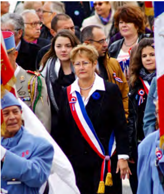
Défilé du 11 novembre 2018

Le président de la République a promis une suppression de la taxe d'habitation en mai 2017 sans savoir, aujourd'hui fin 2018, dans quelle poche il allait puiser, pour financer cette mesure !