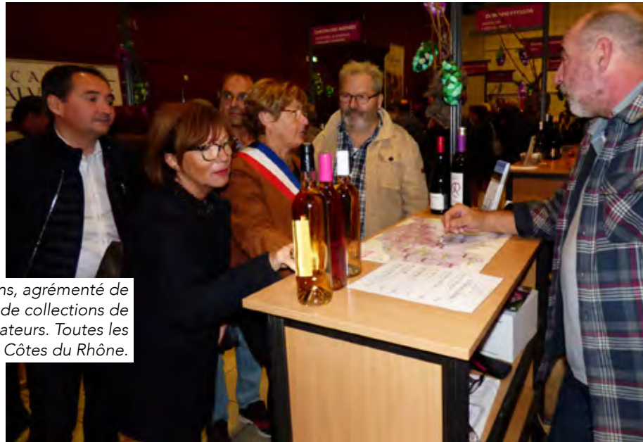
Organisé par le Comité des fêtes le salon des vins, agrémenté de produits régionaux, de sculptures en sucre et même de collections de capsules de champagne, a attiré de nombreux amateurs. Toutes les régions viticoles étaient représentées, surtout les Côtes du Rhône.