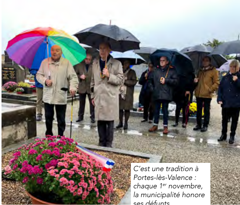
C'est une tradition à Portes-lès-Valence : chaque 1 er novembre, la municipalité honore ses défunts.