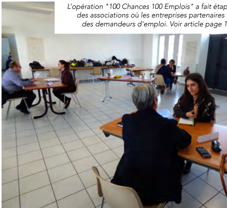
L'opération "100 Chances 100 Emplois" a fait étape à la Maison des associations où les entreprises partenaires ont rencontré des demandeurs d'emploi. Voir article page 13. 15-11-2018