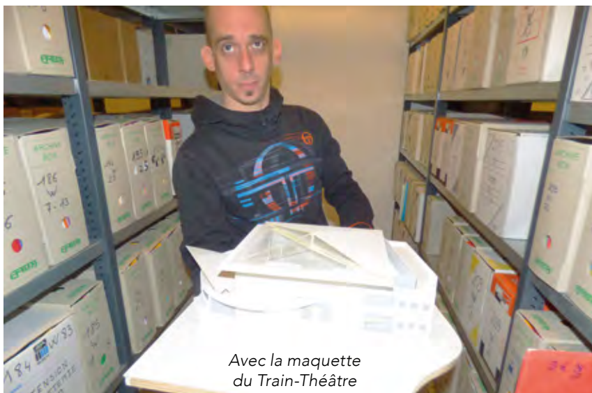
Avec la maquette du Train-Théâtre

* Employé par l'Agglo, il partage son temps entre les communes de Portes-lès-Valence, Bourg-lès-Valence, Chatuzange-le-Goubet, Châteauneuf-sur-Isère, Combovin, Upie, Malissard, Montélier et Chabeuil.