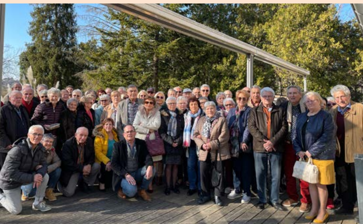
80 adhérents du Club Ambroise Croizat ont partagé un repas dégustation autour du chevreau à Saint-Donat. Prochain rendez-vous le 7 avril pour le repas des anniversaires du semestre. 5-03-2022