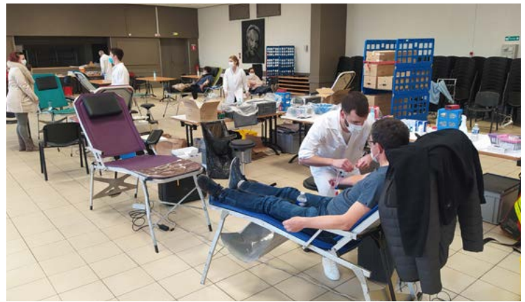
Plus d'une cinquantaine de donateurs ont répondu présents à l'appel de l'Établissement Français du Sang. 15-02-2022