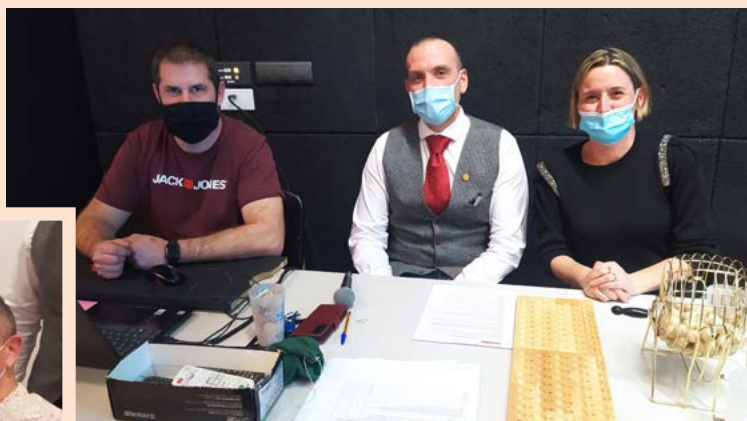
Petit clin d'œil aux bénévoles de l'USCP Basket, qui se sont mobilisés pour la réussite du loto. 25-02-2022