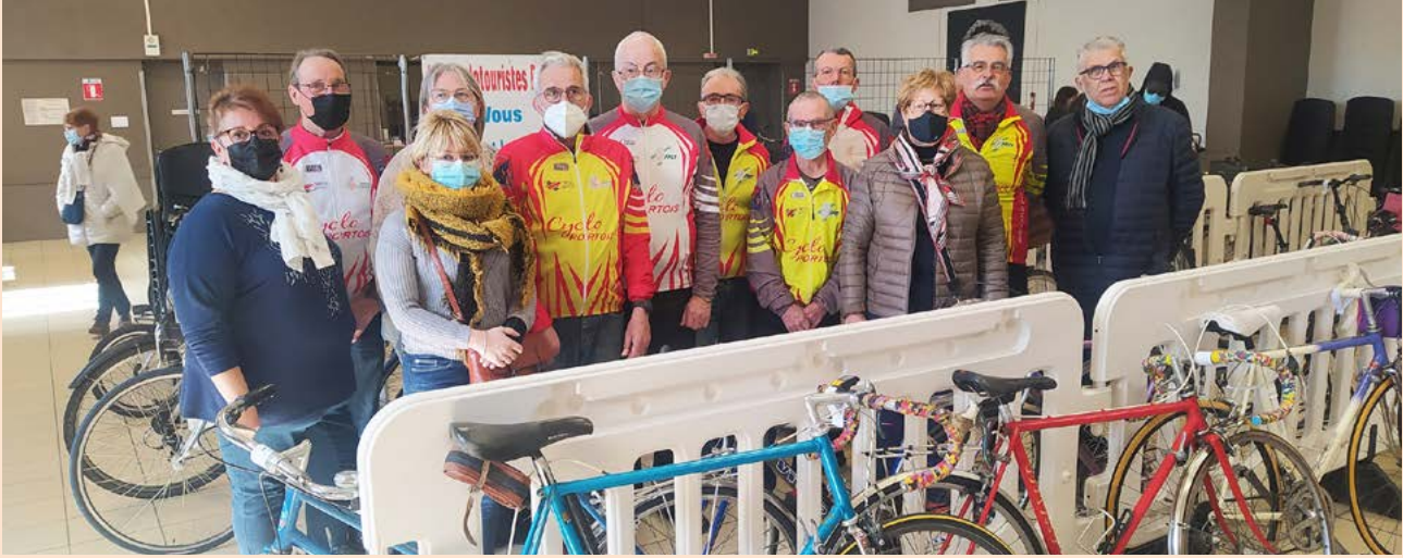
Les activités reprennent pour les Cyclotouristes qui, le 26 février, organisaient leur 7 e bourse aux vélos. 150 cycles d'occasion de toutes tailles étaient proposés à la vente.

Pas facile d'affronter le 1 er du championnat (seniors D1 district Drôme Ardèche). Après avoir bien résisté en 1 ère mi-temps, les Portoïsiens s'inclinent à domicile 0 - 5 contre Valence. 27-02-2022