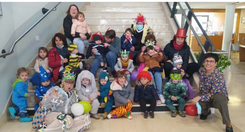
C'est un envahissement bien sympathique de la mairie qui a eu lieu les 1 er , 3 et 4 mars. Déguisés en tortue ninja, princesse, pompier ou même, entre autres, citrouille, les tout petits du Réseau Petite Enfance ont fêté carnaval.