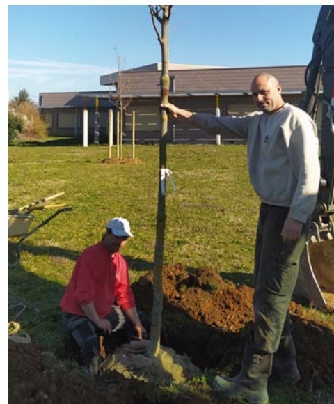
Près d'une dizaine d'arbres ont été plantés derrière l'école Fernand Léger.

Enfin, certains sites n'avaient jusqu'à ce jour aucune végétation. Tel est le cas d'un vaste terrain situé le long des écoles Fernand Léger et Jean Moulin dont les élèves vont pouvoir profiter. Alors que la réalisation du futur arboretum vient de commencer et se poursuivra bientôt avec la construction des sentiers qui vont le sillonner, toutes ces plantations s'inscrivent pleinement dans un plan de végétalisation de notre ville.