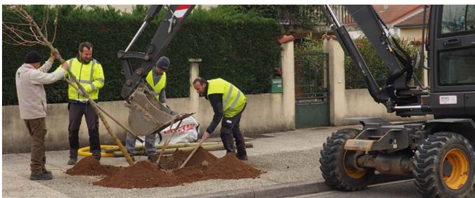
De nombreuses variétés ont été plantées dans toute la ville. On reconnaîtra parmi elles des frênes, des chênes et des platanes.