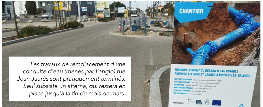
Les travaux de remplacement d'une conduite d'eau (menés par l'anglo) rue Jean Jaurès sont pratiquement terminés. Seul subsiste un alterna, qui restera en place jusqu'à la fin du mois de mars.