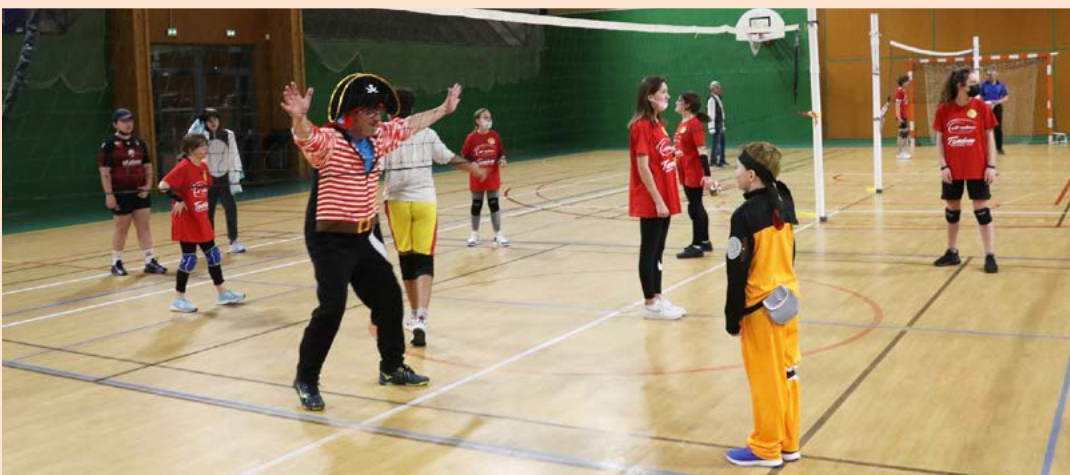
C'était carnaval pour l'USCP Volley le 17 février. Pour la première fois, le club a organisé un tournoi déguisé. Mario Kart contre les villages people ou Pirate des Caraïbes, ça valait le détour !