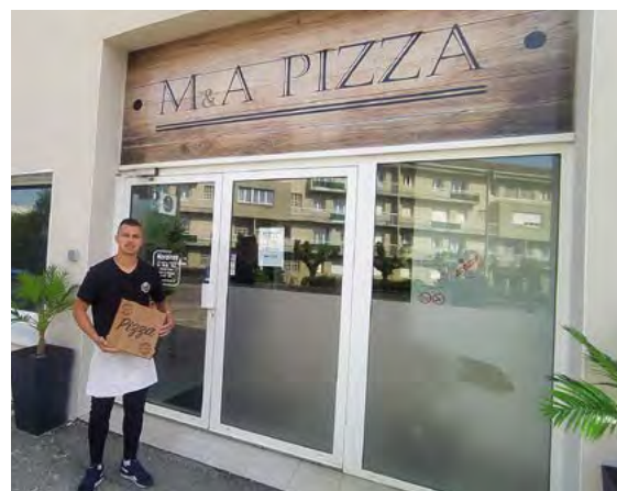
M&A Pizza, 33 bis rue Émile Zola 07 49 07 89 67

Ouverte les lundis, mardis, jeudis et vendredis de 11h à 14h et de 18h à 21h30 ; les samedis et dimanches de 18h à 22h.