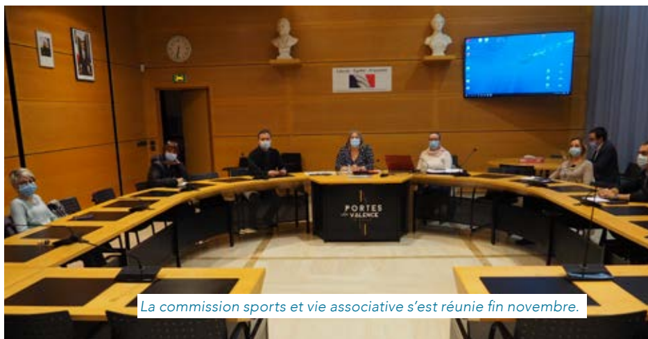
La commission sports et vie associative s'est réunie fin novembre.

Destinées à faciliter le fonctionnement du conseil municipal, elles ont un rôle consultatif et sont avant tout un lieu de débats et d'échanges afin de faire le point sur une situation, une festivité ou un projet. C'est ainsi que la commission urbanisme est amenée à évoquer d'importants projets (comme par exemple cette année le projet de gymnase), ou comme la commission des finances qui examine chaque année le projet du budget. C'est aussi là que sont examinées les demandes de subventions émanant des associations. Les commissions émettent des avis, les décisions étant ensuite votées en conseil municipal.