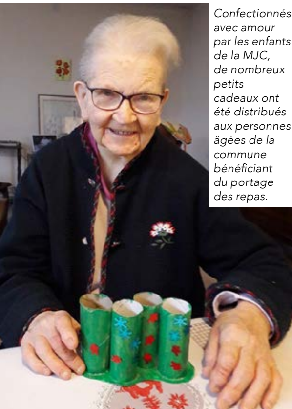
Confectionnés avec amour par les enfants de la MJC, de nombreux petits cadeaux ont été distribués aux personnes âgées de la commune bénéficiant du portage des repas.