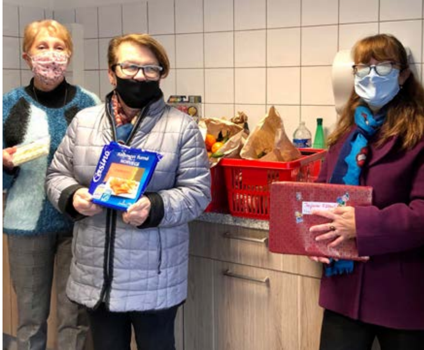
La préparation de colis de Noël nécessite toute une organisation menée par les bénévoles du CCAS. 24-12-2020