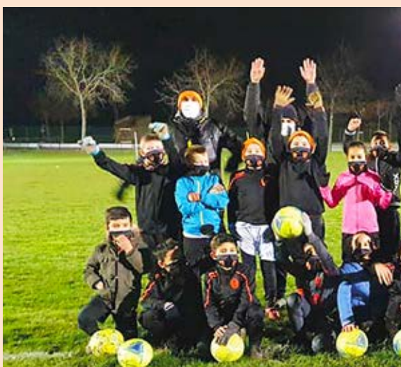
Avec les masques certes, mais le plaisir de se retrouver pour les U10 et U11 du Football Club Portois. 06-01-2021