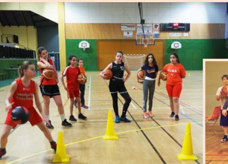
En gardant leurs distances quand c'est possible, filles et garçons de l'USCP Basket ont retrouvé le chemin du gymnase Delaune et de la Halle des sports. 04-01-2021