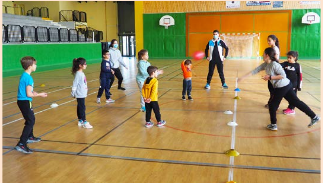
Le judo, c'est aussi de la détente pour les enfants avec une belle partie de balle au prisonnier lors du stage ! 29-12-2020