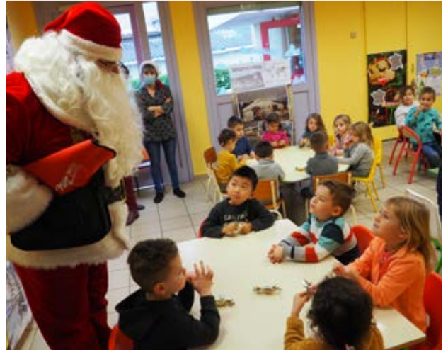
Le Père Noël a continué sa tournée fin décembre dans les restaurants scolaires de la ville pour une distribution de friandises.