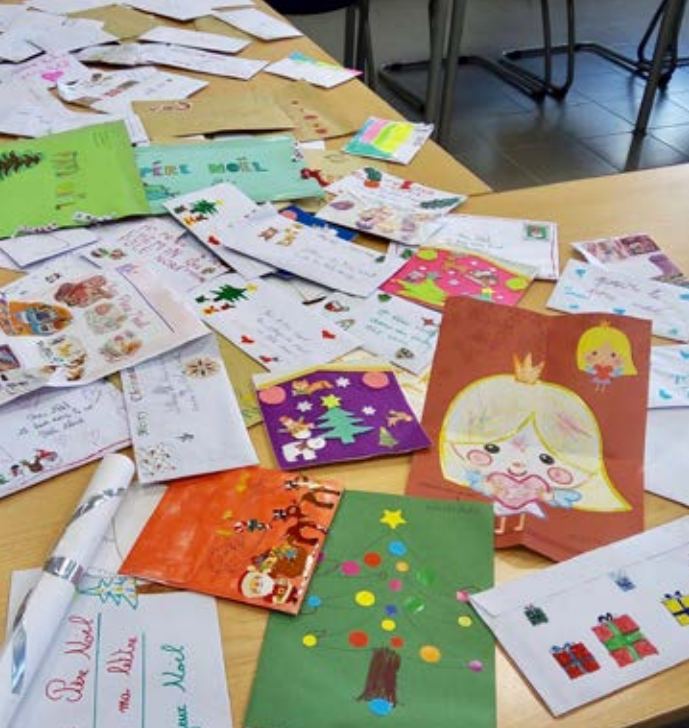
La traditionnelle boîte aux lettres du Père Noël n'a pas désempilé. Les lutins ont dû ouvrir 240 enveloppes qu'ils n'ont pas manqué de transmettre à l'homme en rouge.