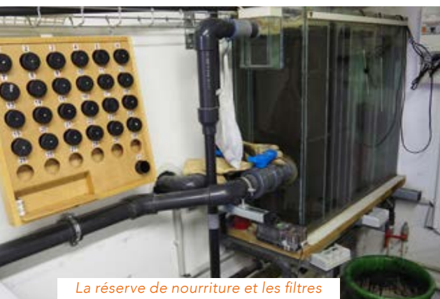
La réserve de nourriture et les filtres

Depuis plus de vingt ans, les visiteurs peuvent admirer dans le hall de la mairie un magnifique aquarium d'eau douce de 1300 litres environ. Il est peuplé d'une trentaine de poissons, essentiellement originaires d'Amérique du Sud. Tous les jours, ils sont nourris par l'agent d'accueil de la mairie grâce à des boîtes préparées à l'avance par Grégory Filleul. Actuellement, c'est lui, qui chaque semaine, s'occupe de l'entretien de l'aquarium et du nettoyage des filtres.