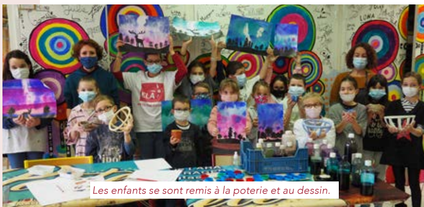
Les enfants se sont remis à la poterie et au dessin.