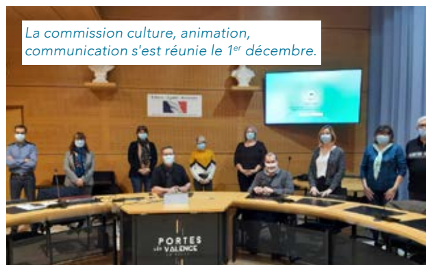
La commission culture, animation, communication s'est réunie le 1 er décembre.