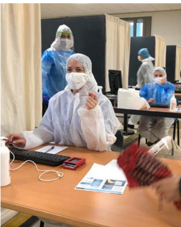
Du 18 au 24 décembre salle Georges Brassens, la Région organisait des tests de dépistage antigéniques de la Covid-19 gratuits. 1 500 personnes ont pu se faire dépister avant Noël.