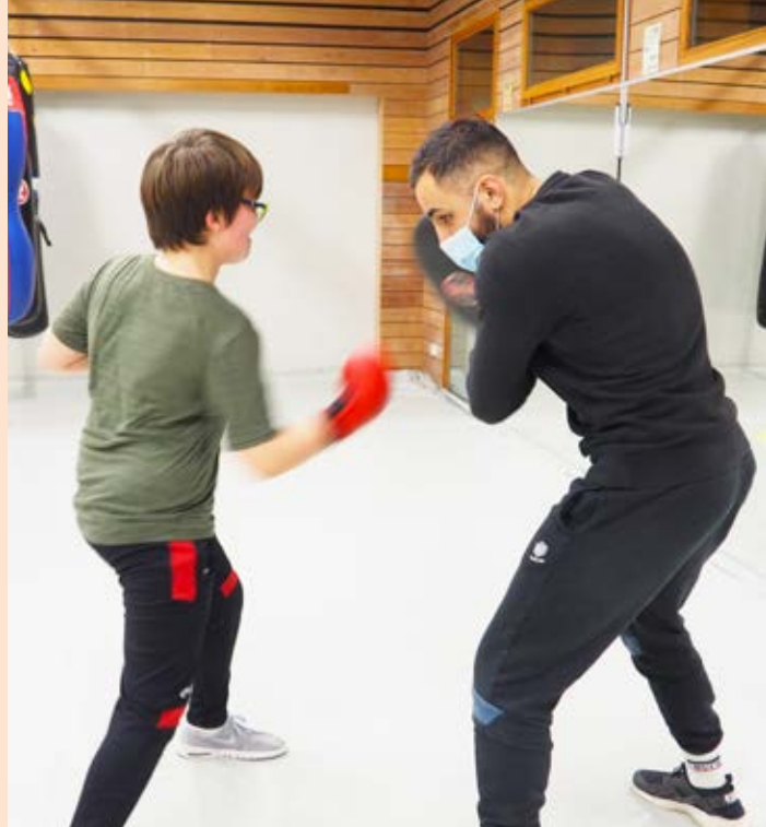
Retour à l'Espace Jurietti pour les jeunes du Boxe Ring Portois et Valentinois. Un bon moyen pour se défouler. 04-01-2021

Depuis mi-décembre, les clubs avaient rouvert petit à petit leurs portes aux mineurs. Malgré un couvre-feu à 20h, la plupart des associations sportives avaient retrouvé le chemin des salles portaises. Les sports pratiqués en extérieur avaient eux repris les entraînements en début de soirée. Le 12 janvier, le préfet de la Drôme décidait de ramener le couvre-feu à 18h, ce qui obligea le service des sports à redistribuer les horaires de nos salles sur les mercredis et les week-ends. Depuis le 16 janvier et les nouvelles mesures, tout est de nouveau fermé.