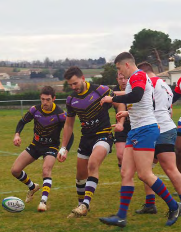
La victoire de l'US Véore XV, lors du match en retard contre Le Teil, lui a permis de prendre la tête de sa poule. 09-02-2020