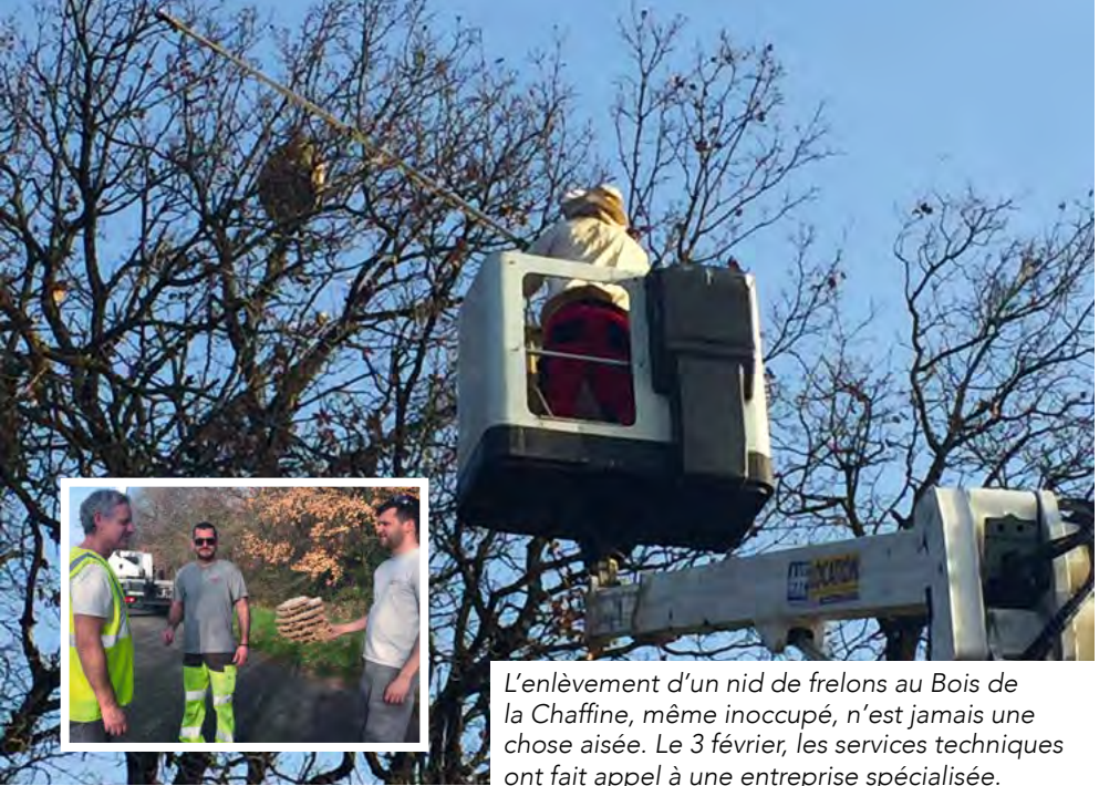
L'enlèvement d'un nid de frelons au Bois de la Chaffine, même inoccupé, n'est jamais une chose aisée. Le 3 février, les services techniques ont fait appel à une entreprise spécialisée.