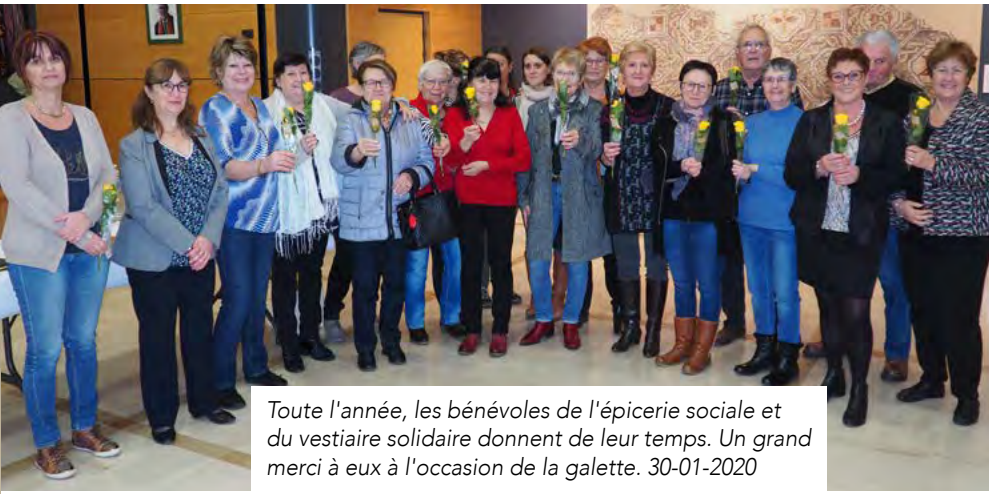
Toute l'année, les bénévoles de l'épicerie sociale et du vestiaire solidaire donnent de leur temps. Un grand merci à eux à l'occasion de la galette. 30-01-2020