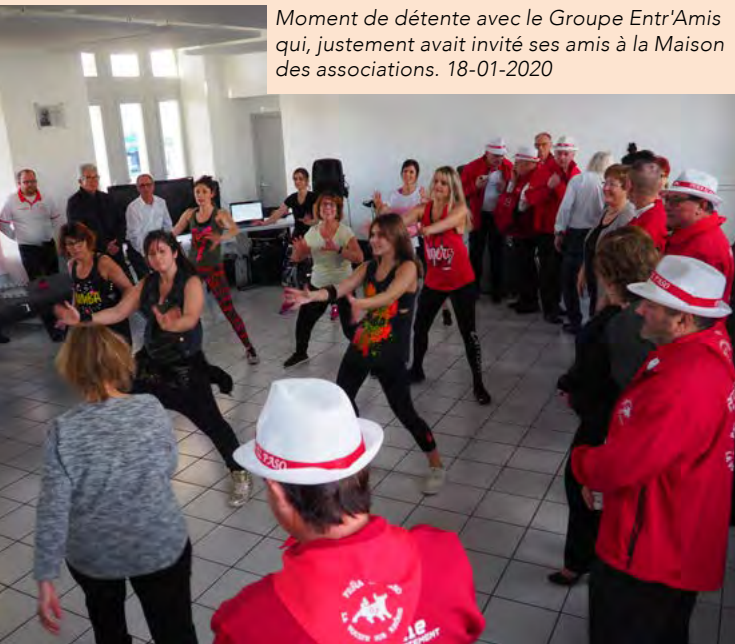
Moment de détente avec le Groupe Entr'Amis qui, justement avait invité ses amis à la Maison des associations. 18-01-2020