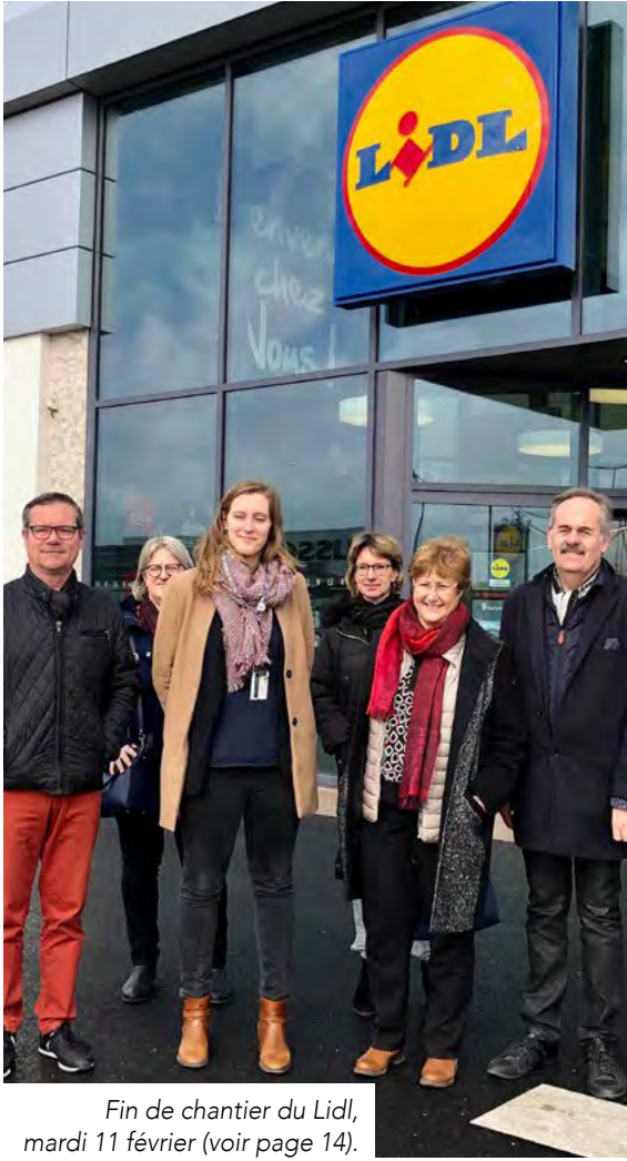
Fin de chantier du Lidl, mardi 11 février (voir page 14).