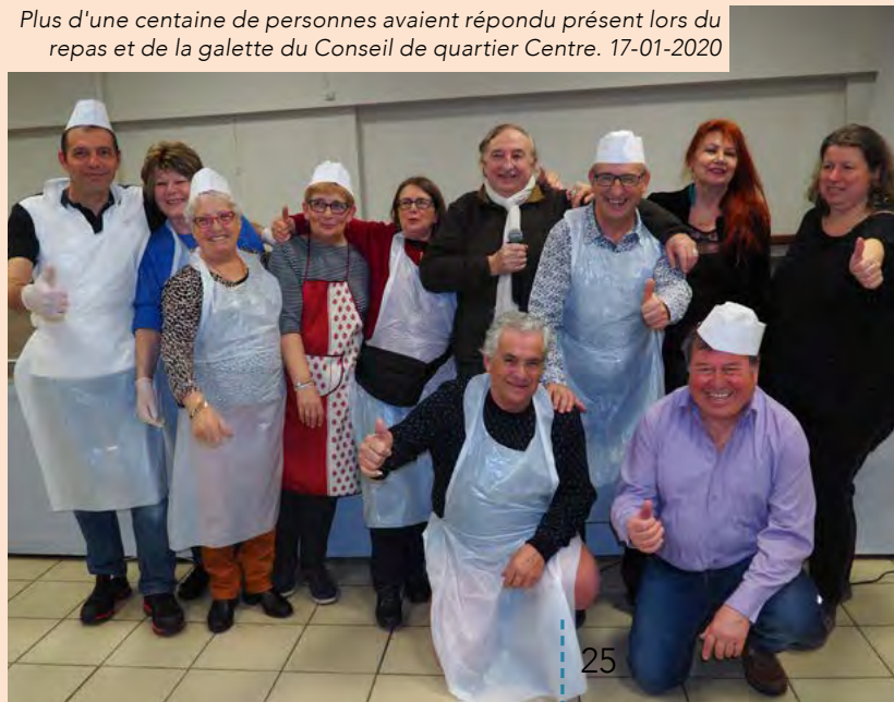
Plus d'une centaine de personnes avaient répondu présent lors du repas et de la galette du Conseil de quartier Centre. 17-01-2020