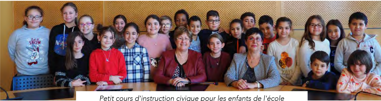
Petit cours d'instruction civique pour les enfants de l'école élémentaire Voltaire venus visiter la mairie. 04-02-2020