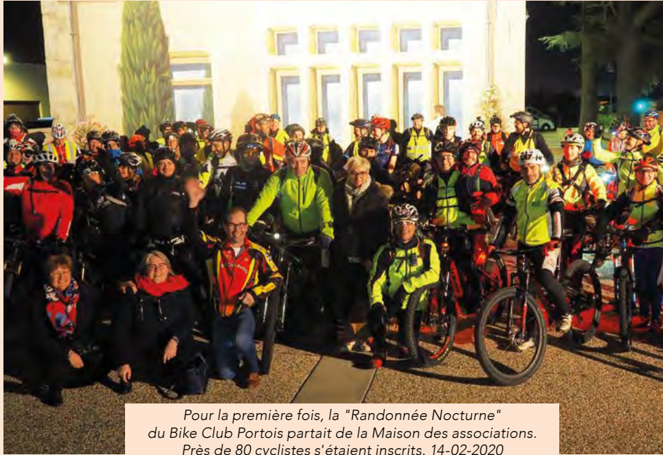
Pour la première fois, la "Randonnée Nocturne" du Bike Club Portoais partait de la Maison des associations. Près de 80 cyclistes s'étaient inscrits. 14-02-2020