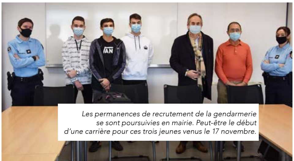
Les permanences de recrutement de la gendarmerie se sont poursuivies en mairie. Peut-être le début d'une carrière pour ces trois jeunes venus le 17 novembre.