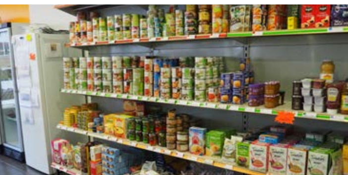
L'Épicerie sociale et solidaire "La Passerelle" au centre commercial Les Arcades.

Après passage en commission, il peut être décidé une aide alimentaire donnant accès à l'Épicerie sociale pendant quelques mois. En effet, chaque euro dépensé à l'Épicerie sociale donne droit à l'achat de l'équivalent de 10 à 12€ de denrées. L'économie ainsi réalisée peut vous permettre de faire face à une difficulté financière momentanée. Si votre situation est plus difficile, le paiement d'une facture est une des options possibles.