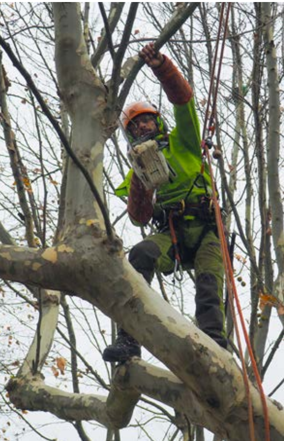
Régulièrement, les arbres de nos espaces verts sont élagués par des professionnels. Ce fut le cas début décembre, notamment au parc Louis Aragon, avec l'aide de l'entreprise cretoise Arboret'homme élagage.