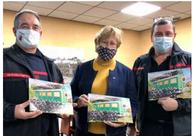
Après la présentation du calendrier des pompiers de Portes-lès-Valence au maire, la distribution a commencé dans des conditions particulières : Covid-19 oblige, la traditionnelle tournée n'aura pas lieu. Vous pourrez vous le procurer dans les commerces ou directement à la caserne jusqu'au 15 janvier.