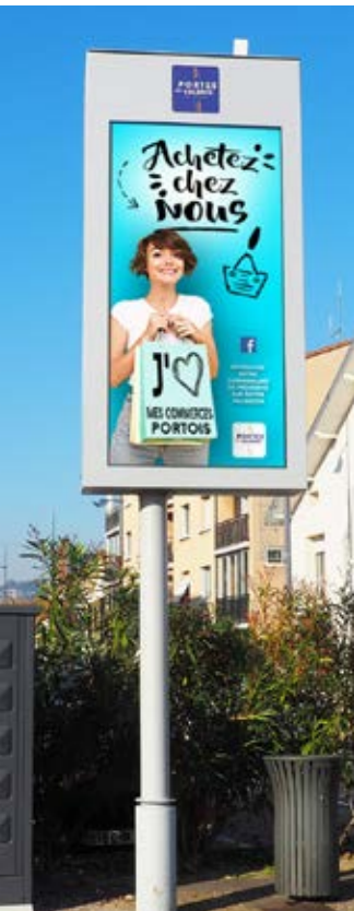
Plus fonctionnel et plus visible, un nouveau panneau lumineux a été installé à l'angle des rues Jean Jaurès et Pierre Semard. Il diffuse toute la journée des informations municipales.