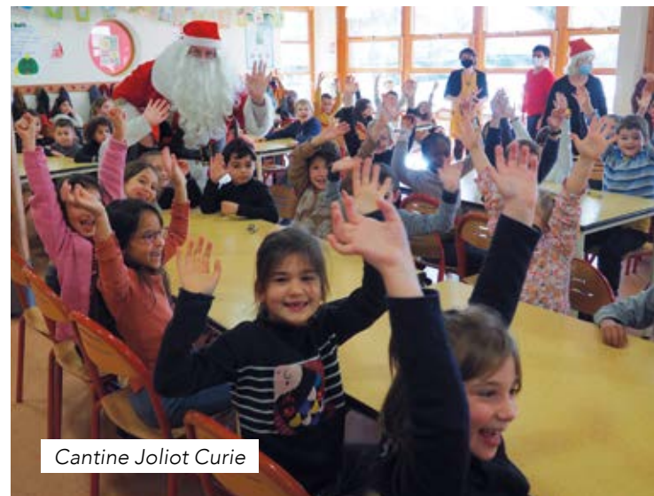
Cantine Joliot Curie