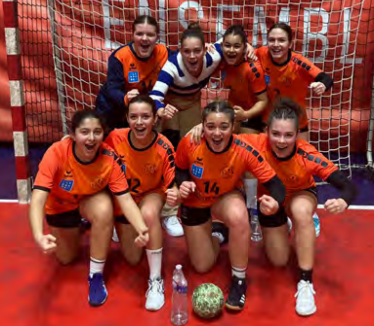
Le 1 er mars, les minimes filles de l'UNSS handball du collège Jean Macé sont devenues championnes d'académie Excellence. Elles ont disputé le 5 avril dernier le championnat inter-régional.