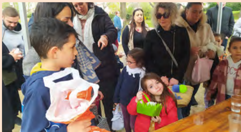
Visiblement, la perspective de déguster de bons chocolats a été plus forte que la pluie ! Le 1 er avril, 116 enfants venus de toutes nos écoles ont "chassé" les œufs au parc Léo Lagrange. Plus de 1000 œufs factices avaient été cachés dans le parc par les bénévoles de l'Association des conseils de quartier, à charge pour les enfants de les échanger ensuite contre de vraies friandises.

Formé au club de rugby de Beauvallon (avant la fusion avec l'US Véore XV), Sébastien Chabal revient régulièrement sur les terres de ses premiers exploits. Le 22 mars, l'ancien 3 e ligne de l'équipe de France est venu tourner avec les enfants une vidéo pour le recyclage des téléphones portables qui sera diffusée lors de la prochaine Coupe du Monde.