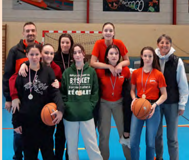
Bravo aux minimes filles de l'UNSS basket du collège Jean-Macé. Le 1 er mars à Saint Sorlin (26), elles ont décroché le titre bi-départemental et disputeront prochainement le championnat d'académie en Ardèche.