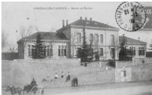
Un élément de notre patrimoine architectural : la maison des associations, ici en 1910, qui abrita une école et la première mairie.