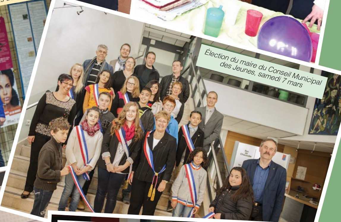
Élection du maire du Conseil Municipal des Jeunes, samedi 7 mars