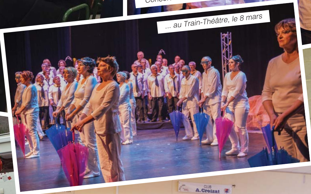
... au Train-Théâtre, le 8 mars