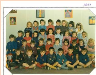
Mes jeunes années... 1965