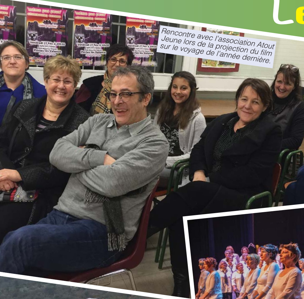
Rencontre avec l'association Atout Jeune lors de la projection du film sur le voyage de l'année dernière.