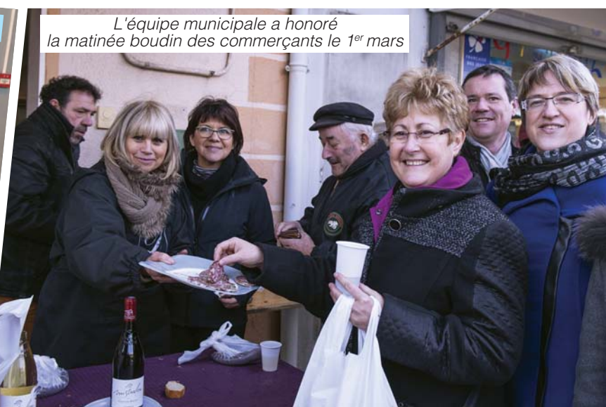
L'équipe municipale a honoré la matinée boudin des commerçants le 1 er mars