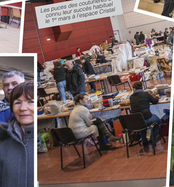
Les puces des couturières ont connu leur succès habituel le 1er mars à l'espace Cristal