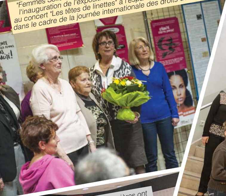
"Femmes Solidaires" a honoré une de ses membres le jour de l'inauguration de l'exposition "l'égalité c'est pas sorcier" suite au concert "Les têtes de linottes" à l'espace Baronissi, le 7 mars, dans le cadre de la journée internationale des femmes.