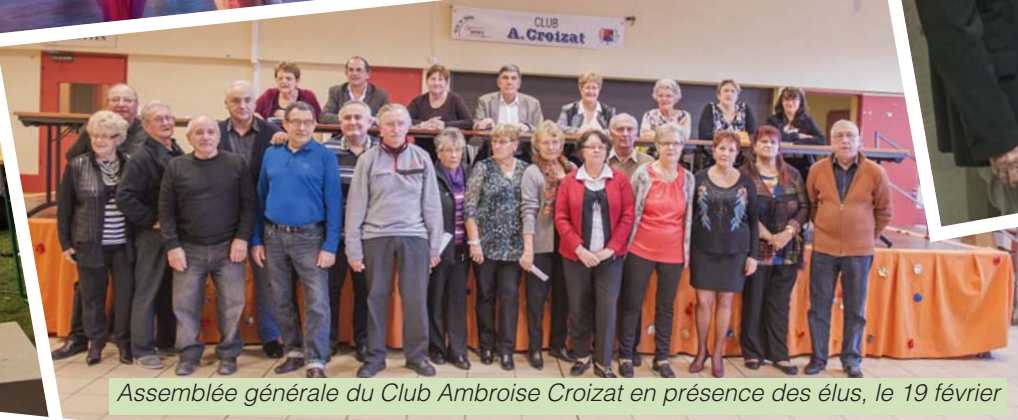
Assemblée générale du Club Ambroise Croizat en présence des élus, le 19 février