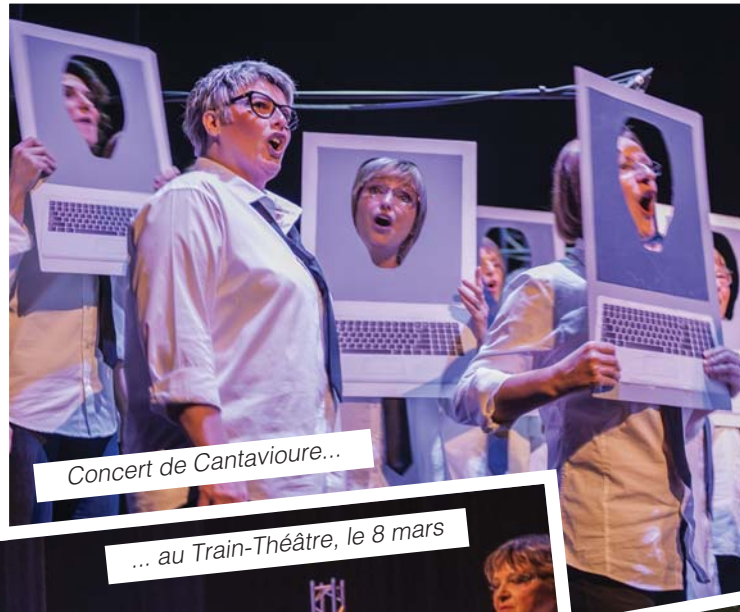
Concert de Cantavioure...