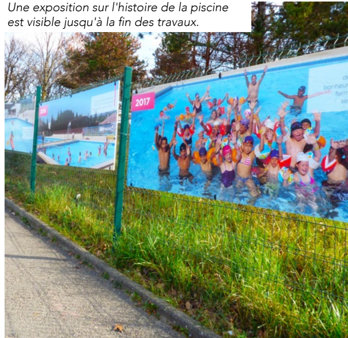
Une exposition sur l'histoire de la piscine est visible jusqu'à la fin des travaux.