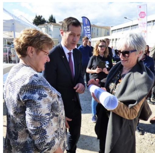
Les discours prononcés à l'occasion de la pose de la 1 ère pierre de la future piscine ont été enfermés dans un tube pour être coulés dans le béton. (voir p6)