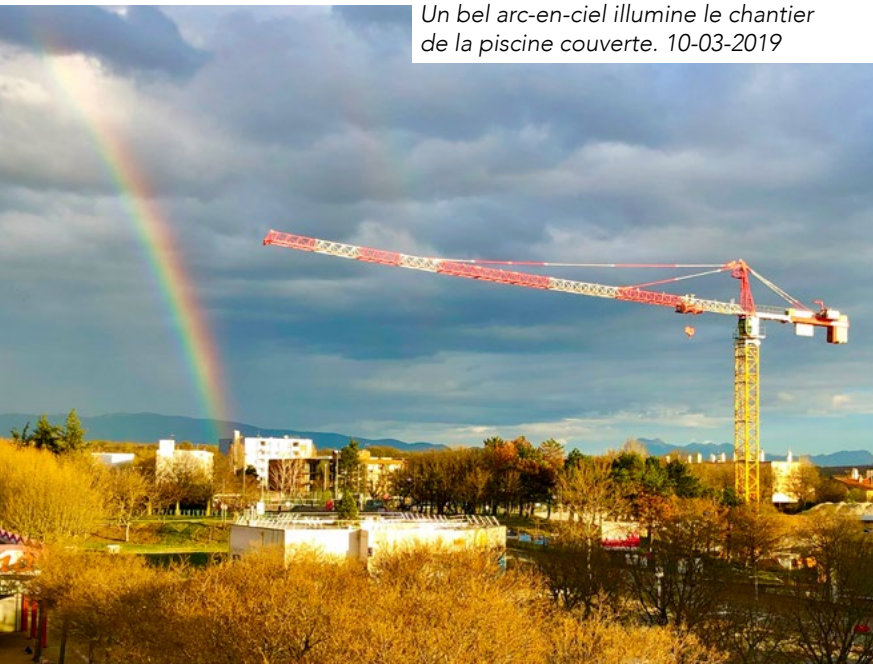
Un bel arc-en-ciel illumine le chantier de la piscine couverte. 10-03-2019