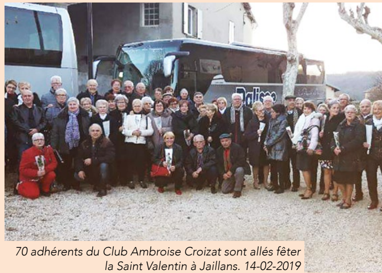
70 adhérents du Club Ambroise Croizat sont allés fêter la Saint Valentin à Jaillans. 14-02-2019