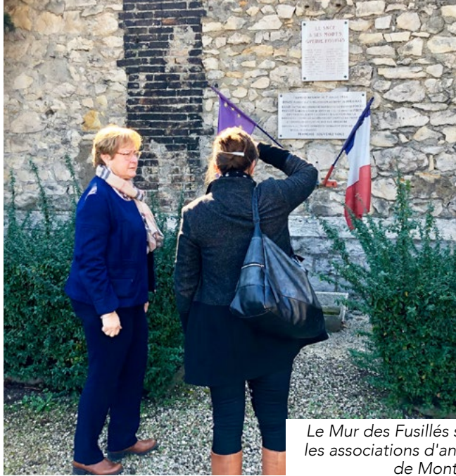
Le Mur des Fusillés sera réaménagé et ouvert à tous. Dans cette optique, les associations d'anciens combattants portoises et le mémorial de la prison de Montluc ont été associés au projet. 19-02-2019