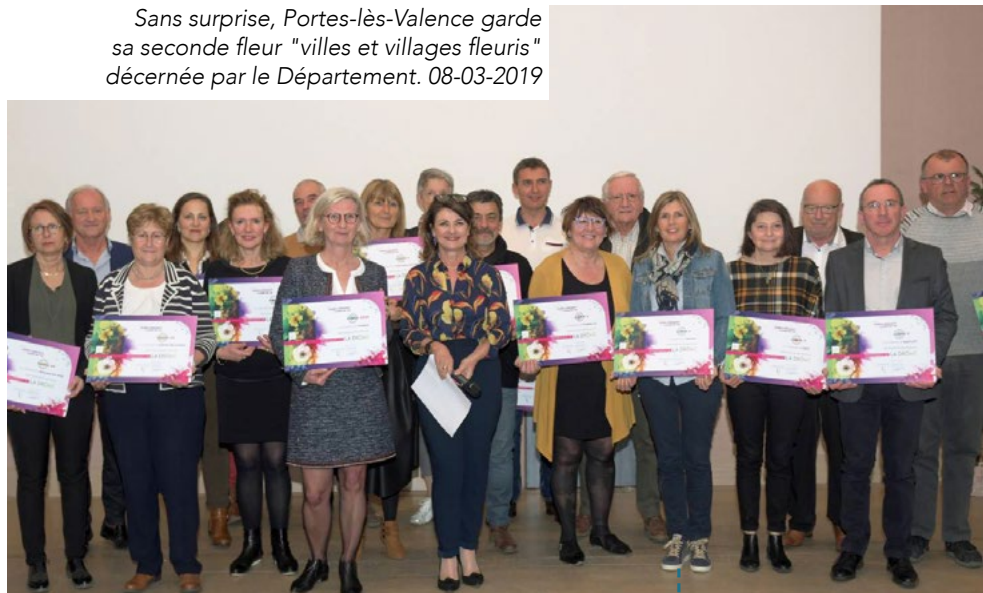
Sans surprise, Portes-lès-Valence garde sa seconde fleur "villes et villages fleuris" décernée par le Département. 08-03-2019