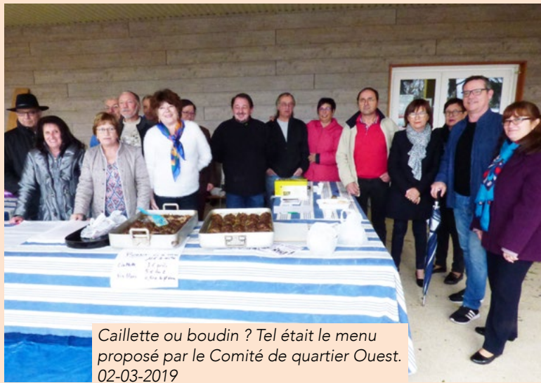
Caillette ou boudin ? Tel était le menu proposé par le Comité de quartier Ouest. 02-03-2019