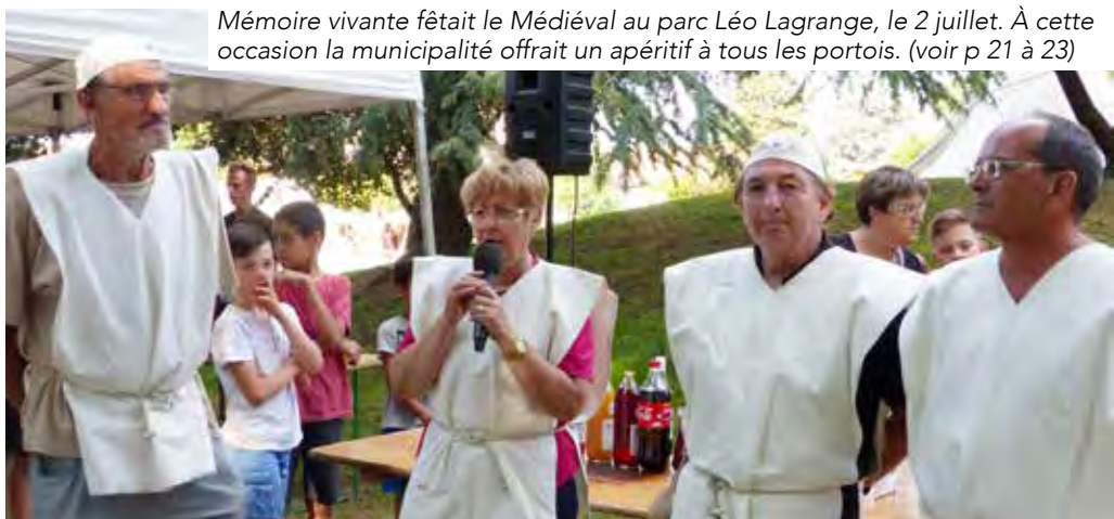
Mémoire vivante fêtait le Médiéval au parc Léo Lagrange, le 2 juillet. À cette occasion la municipalité offrait un apéritif à tous les portois. (voir p 21 à 23)