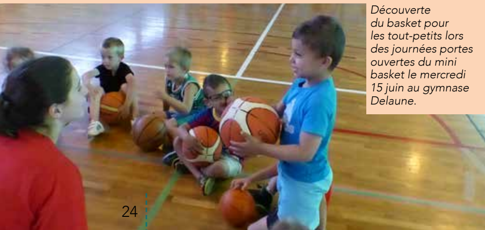
Découverte du basket pour les tout-petits lors des journées portes ouvertes du mini basket le mercredi 15 juin au gymnase Delaune.