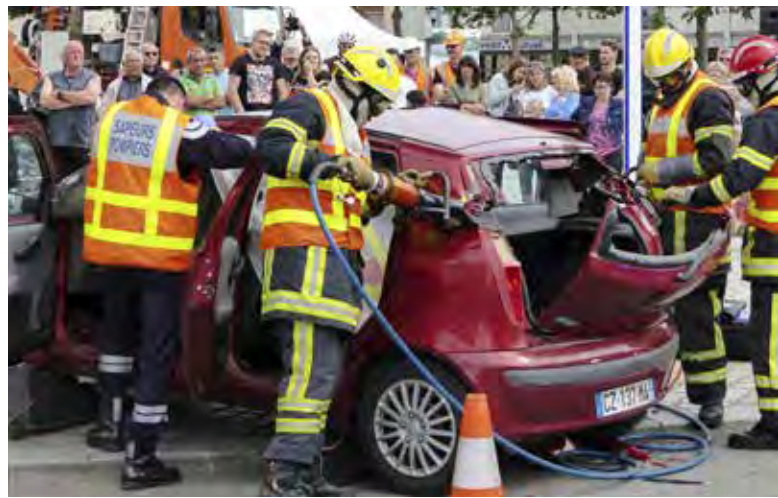
Démonstration publique, place de la mairie

Trois jours consacrés à la sécurité routière et aux gestes de premiers secours étaient organisés sur la commune les 2, 3 et 4 juin dernier. Afin de toucher toutes les générations, des ateliers et des démonstrations étaient proposés aux élèves du collège Jean Macé et aux seniors du Club Ambroise Croizat, durant lesquels ils pouvaient découvrir les bons gestes pour sauver une vie et ceux pour prévenir les accidents. Pour le public, une simulation de prise en charge par les pompiers d'un accident, avec désincarcération d'un blessé, divers stands, simulateur de conduite, sécurité sur chantier routier, présentation des véhicules de pompiers, étaient mis en scène sur la place de la mairie le samedi matin.