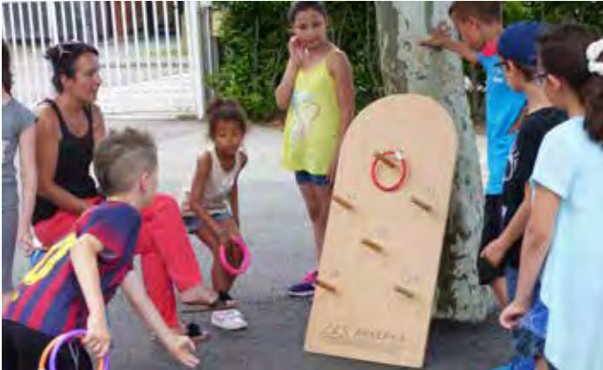
Jeux d'adresse et goûter pour la fin d'année à Fernand Léger