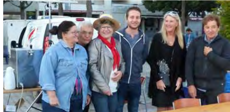
La buvette tenue par l'association "Agir et mieux vivre" lors de la soirée musette du 14 juillet, était au profit de l'association Flor'à vie.

Merci à tous d'être venus nombreux à tous ces événements.