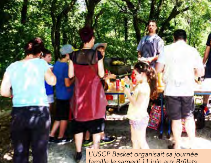
L'USCP Basket organisait sa journée famille le samedi 11 juin aux Brûlats