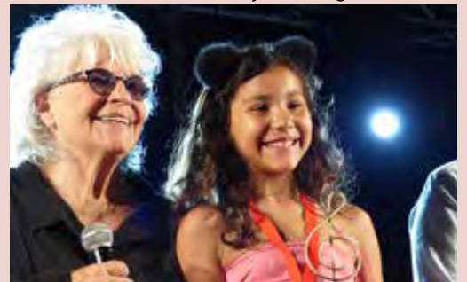
Miss Sahna, catégorie enfant