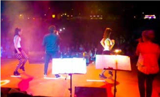
Le bal qui a suivi le feu d'artifice le 13 juillet a attiré un large public malgré la fraîcheur de cette soirée d'été.