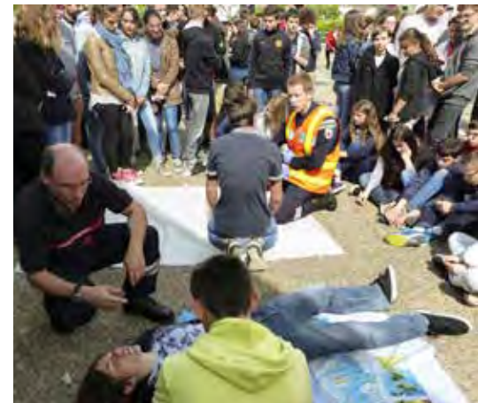
Avec les adolescents du Collège Jean Macé