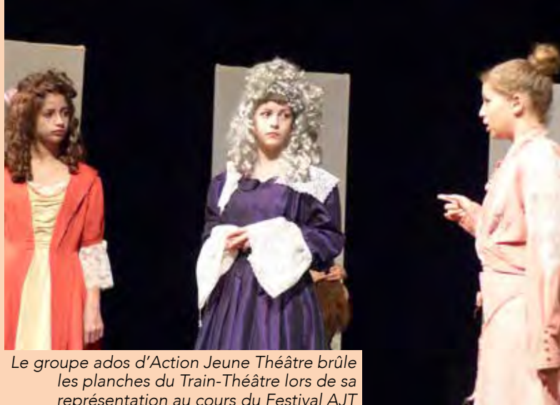
Le groupe ados d'Action Jeune Théâtre brûle les planches du Train-Théâtre lors de sa représentation au cours du Festival AJT