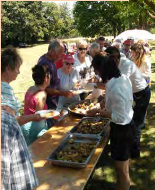
Pique-nique ensoleillé pour le Club Ambroise Croizat, le 23 juin aux Brûlats