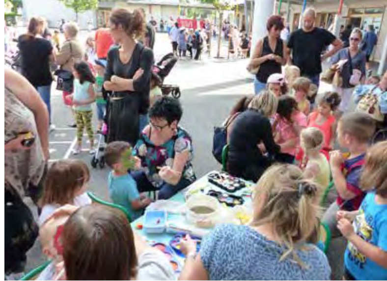
Instant maquillage pendant la kermesse de Jean Moulin

Les maternelles Voltaire et Anatole France ont exposé leurs œuvres pour le plus grand plaisir des parents. Quant à la maternelle Pasteur, son spectacle sur le thème de l'eau, a rafraîchi un public conquis. Les élèves de l'école Joliot Curie ont joué et chanté devant leurs plus grands fans (famille et amis).