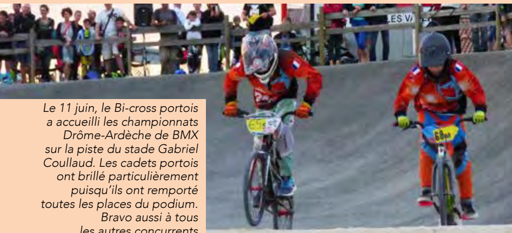
Le 11 juin, le Bi-cross portois a accueilli les championnats Drôme-Ardèche de BMX sur la piste du stade Gabriel Coullaud. Les cadets portois ont brillé particulièrement puisqu'ils ont remporté toutes les places du podium. Bravo aussi à tous les autres concurrents