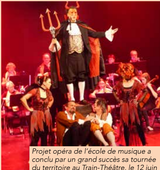
Projet opéra de l'école de musique a conclu par un grand succès sa tournée du territoire au Train-Théâtre, le 12 juin