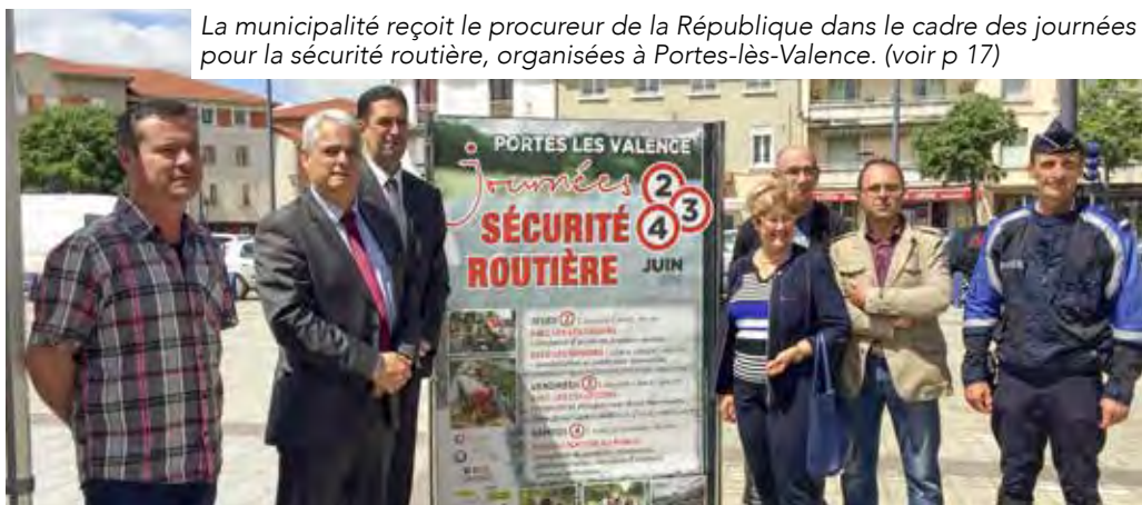
La municipalité reçoit le procureur de la République dans le cadre des journées pour la sécurité routière, organisées à Portes-lès-Valence. (voir p 17)