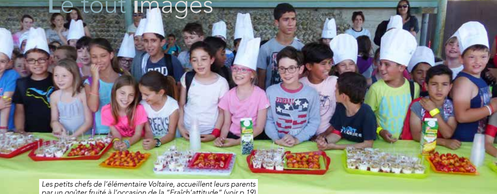
Les petits chefs de l'élémentaire Voltaire, accueillent leurs parents par un goûter fruité à l'occasion de la "Fraîch'attitude" (voir p 19)