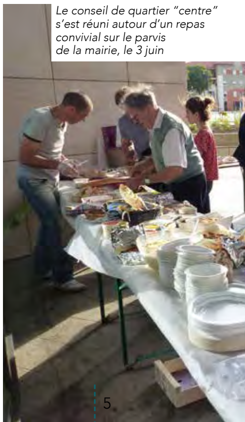
Le conseil de quartier "centre" s'est réuni autour d'un repas convivial sur le parvis de la mairie, le 3 juin