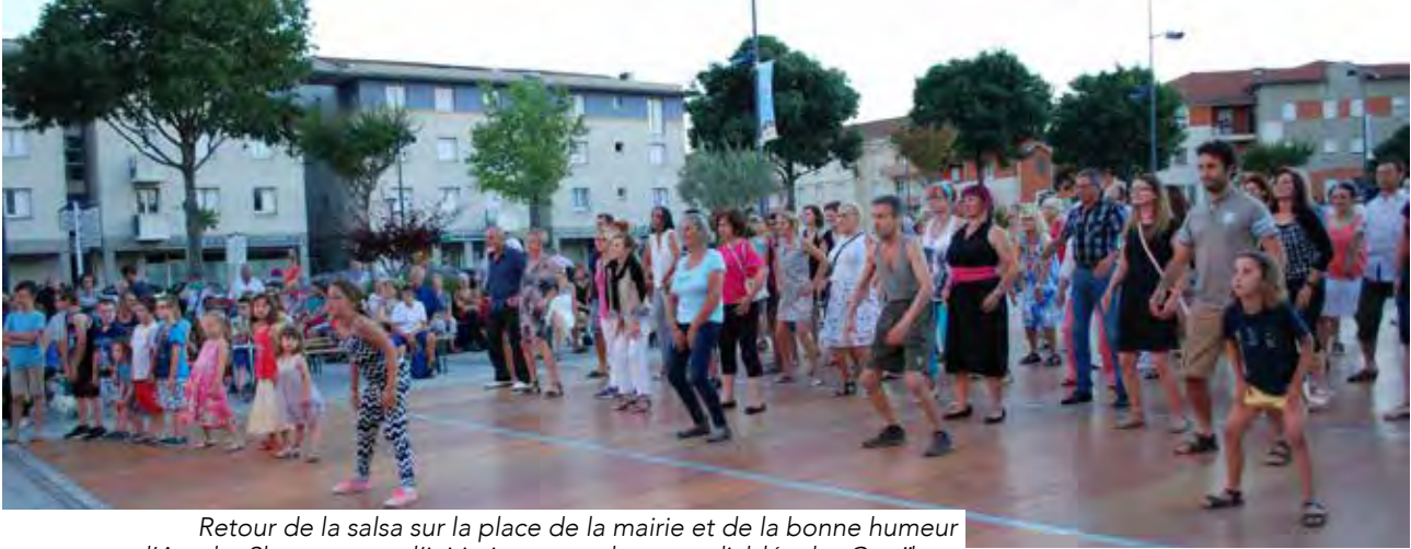
Retour de la salsa sur la place de la mairie et de la bonne humeur d'Atocha Shoman pour l'initiation aux rythmes endiablés des Caraïbes. Le groupe cubain Septeto Nabori assurait la deuxième partie de la soirée du samedi 9 juillet dans une ambiance torride...