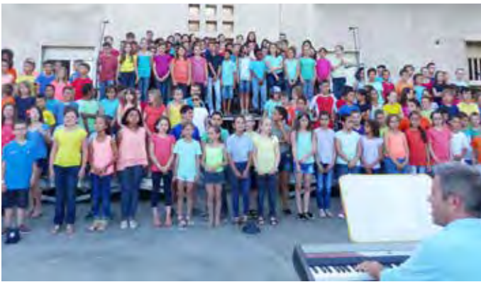
La chorale de Joliot Curie a réuni tous les élèves sur scène.