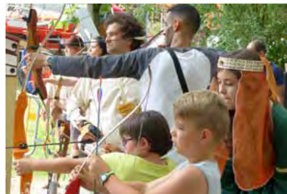
Cours de tir à l'arc et costumes médiévaux pour la fête champêtre du 2 juillet sur le thème du moyen-âge au parc Léo Lagrange