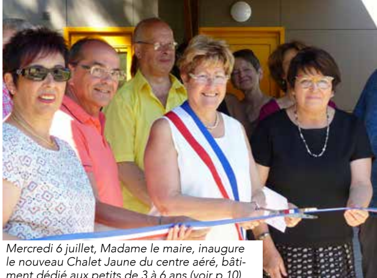
Mercredi 6 juillet, Madame le maire, inaugure le nouveau Chalet Jaune du centre aéré, bâtiment dédié aux petits de 3 à 6 ans (voir p 10)