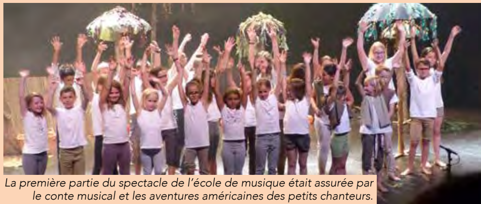
La première partie du spectacle de l'école de musique était assurée par le conte musical et les aventures américaines des petits chanteurs.