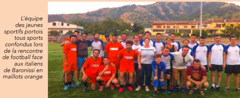
L'équipe des jeunes sportifs portoïis tous sports confondus lors de la rencontre de football face aux italiens de Baronissi en maillots orange