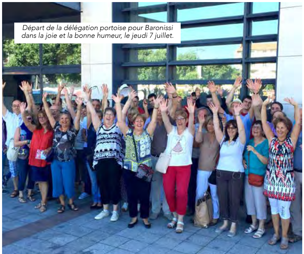
Départ de la délégation portoise pour Baronissi dans la joie et la bonne humeur, le jeudi 7 juillet.