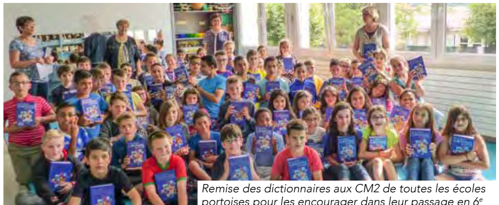
Remise des dictionnaires aux CM2 de toutes les écoles portoises pour les encourager dans leur passage en 6 e