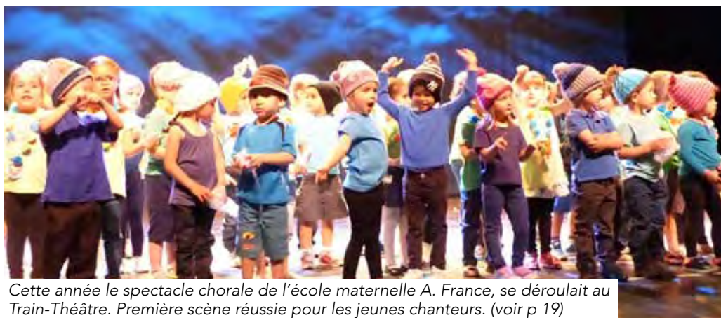
Cette année le spectacle chorale de l'école maternelle A. France, se déroulait au Train-Théâtre. Première scène réussie pour les jeunes chanteurs. (voir p 19)