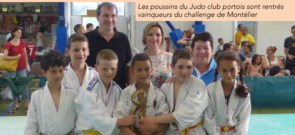
Les poussins du Judo club portois sont rentrés vainqueurs du challenge de Montélier