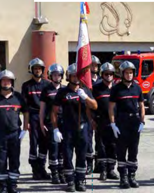
Samedi 11 juin , cérémonie en hommage aux pompiers disparus.