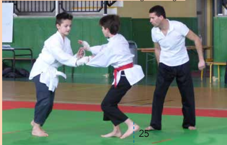
Samedi 11 février, le Viet vu dao portois organisait, à la halle des sports, un tournoi régional auquel pas moins de 8 clubs ont répondu présents et présenté des concurrents dans toutes les catégories d'âge.