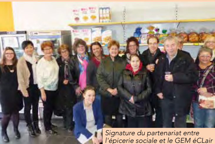
Signature du partenariat entre l'épicerie sociale et le GEM éclair