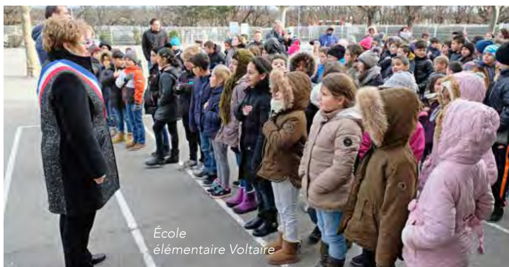
École élémentaire Voltaire

Les Français qui ne sont pas en âge de voter peuvent aussi participer à la vie démocratique. C'est pourquoi, de plus en plus de structures sont mises en place pour que chacun puisse s'exprimer sur les choix qui affecteront son quotidien. On peut citer par exemple les débats publics (Commission nationale du débat public), ou comme sur la commune, les conseils de quartier ou encore le Conseil Municipal des Jeunes. C'est ce qu'on appelle la "démocratie participative" qui fait en sorte que la participation du citoyen et la prise de décision politique soient renforcées. À ce titre, la modification de la Constitution