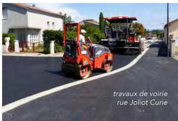
travaux de voirie rue Joliot Curie