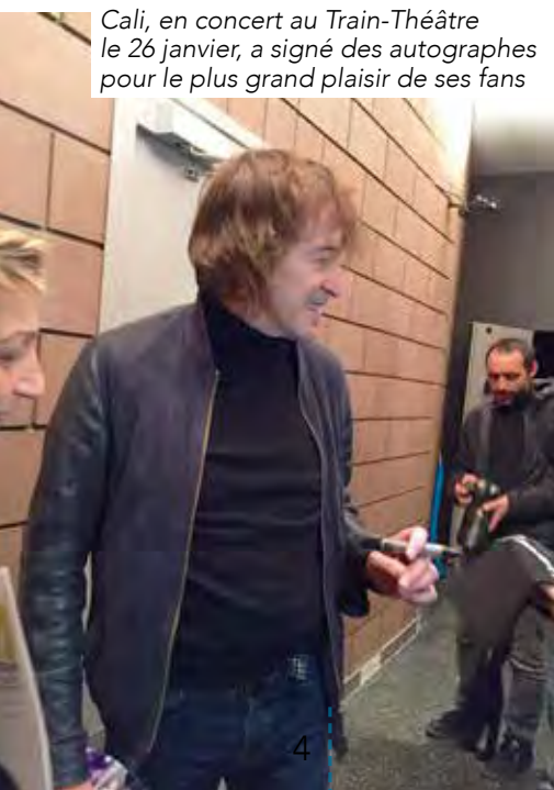
Cali, en concert au Train-Théâtre le 26 janvier, a signé des autographes pour le plus grand plaisir de ses fans