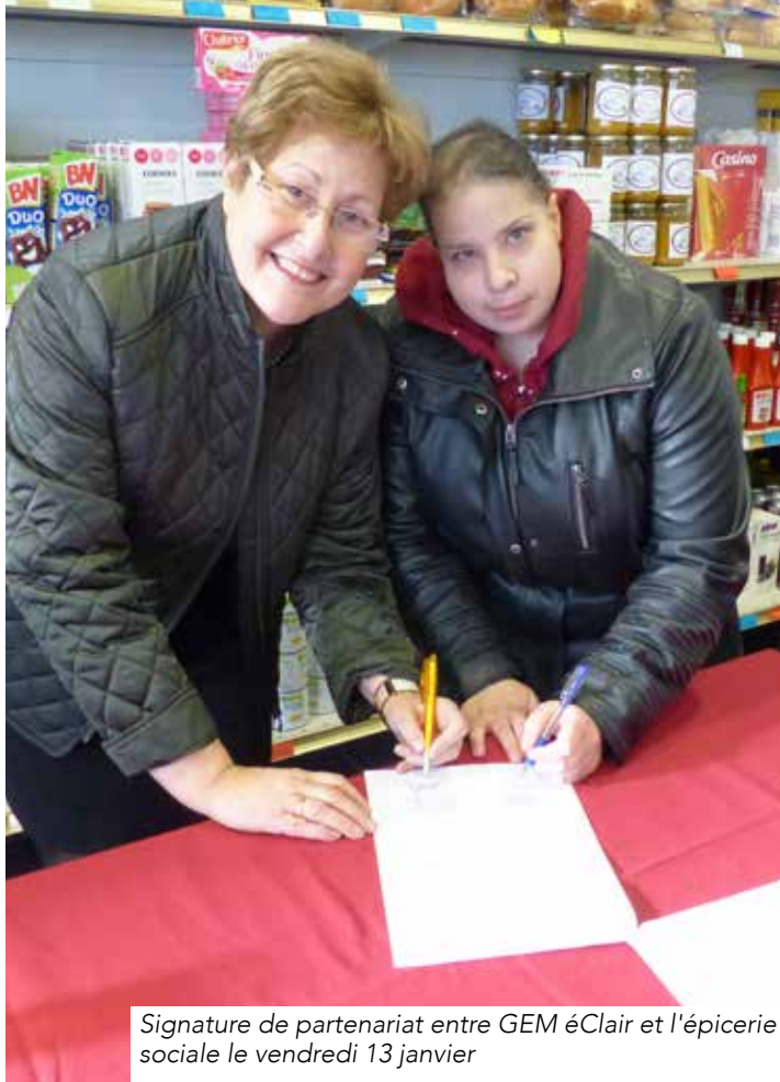
Signature de partenariat entre GEM éClair et l'épicerie sociale le vendredi 13 janvier