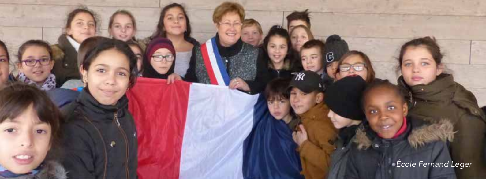
École Fernand Léger