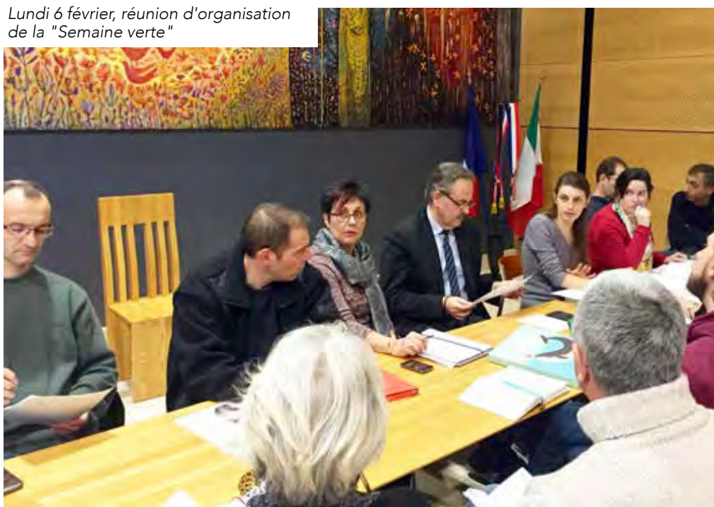
Lundi 6 février, réunion d'organisation de la "Semaine verte"