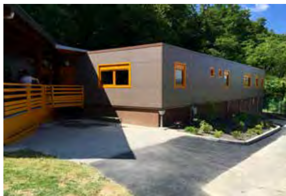
reconstruction du chalet jaune du centre de loisirs