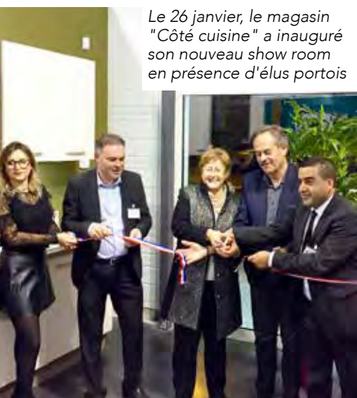
Le 26 janvier, le magasin "Côté cuisine" a inauguré son nouveau show room en présence d'élus portois