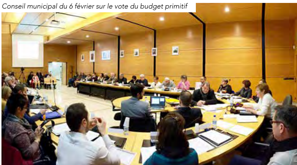
Conseil municipal du 6 février sur le vote du budget primitif