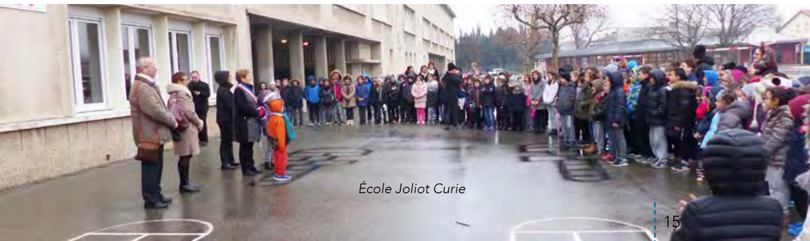
École Joliot Curie