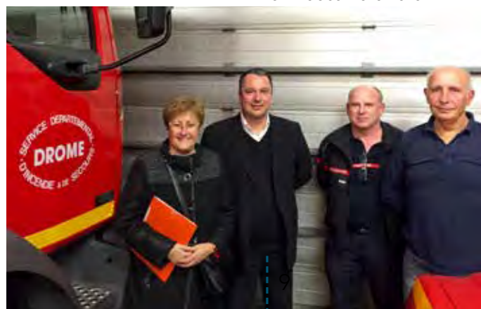
Rencontre avec le Député Franck Reynier, le 12 décembre 2016

demandé depuis 2003. Le SDIS accepte aujourd'hui d'attribuer ce VSAV, élément majeur et condition indispensable à son maintien sur la commune. Cette ambulance permet d'éviter le double engagement de moyens portois et valentinois comme c'est jusqu'à présent le cas lors des secours à la personne. Pour confirmer cette annonce positive, une nouvelle recrue est venue compléter l'équipe des pompiers portois. Bienvenue à Audrey Guelier, qui ajoute une autre légitimité au poste portois puisqu'elle est infirmière de formation.