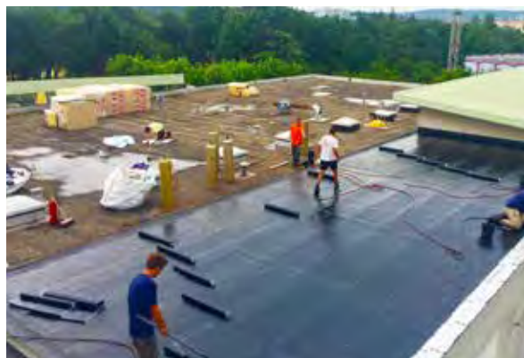
travaux d'étanchéité du groupe scolaire Voltaire

Les recettes d'investissement permettront une réalisation de 3 290 000 €, composées d'investissements nouveaux (2 300 000 €) d'investissements 2016 restant à réaliser (520 000 €) et du remboursement des emprunts (470 000 €).