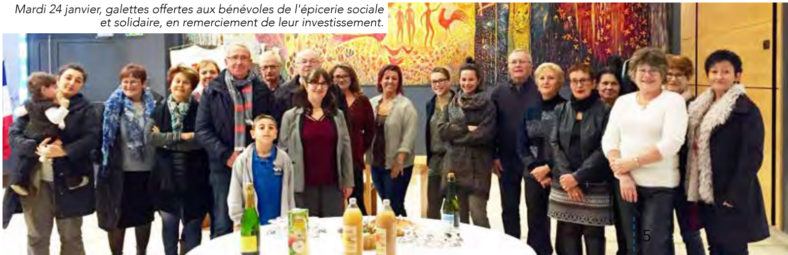
Mardi 24 janvier, galettes offertes aux bénévoles de l'épicerie sociale et solidaire, en remerciement de leur investissement.