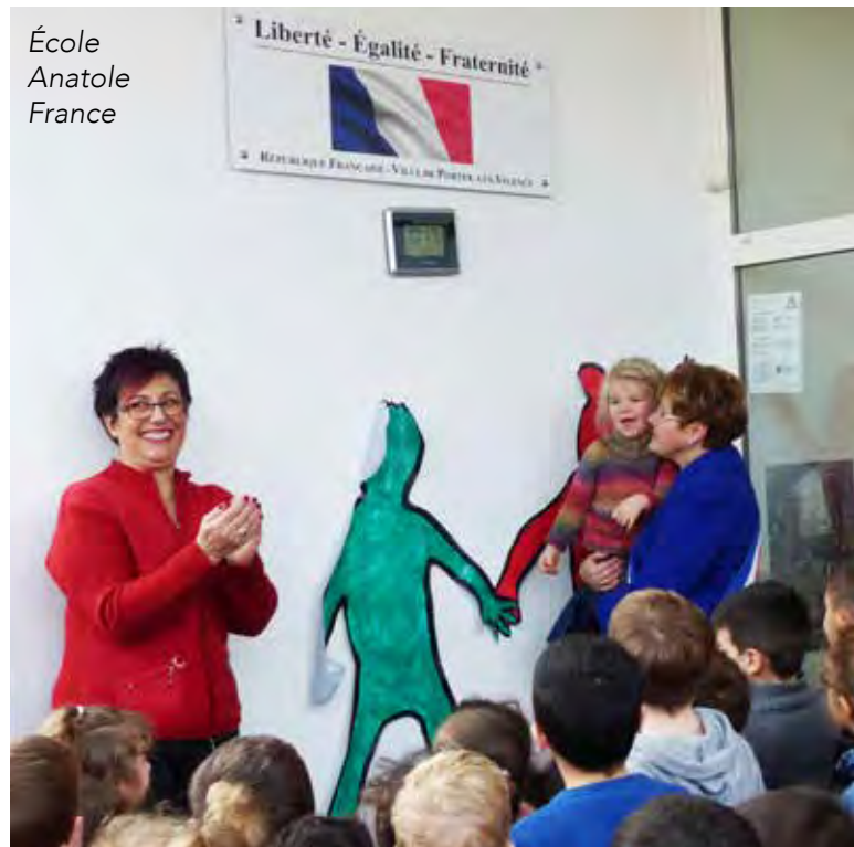
École Anatole France