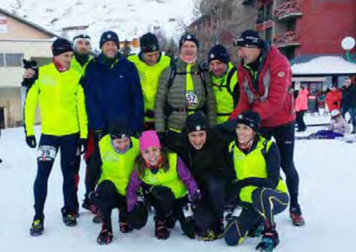
13 membres du Jogging club au snow trail des Deux-Alpes