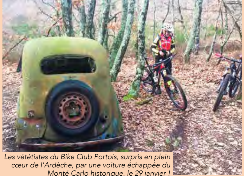
Les vététistes du Bike Club Portoï, surpris en plein cœur de l'Ardèche, par une voiture échappée du Monté Carlo historique, le 29 janvier !