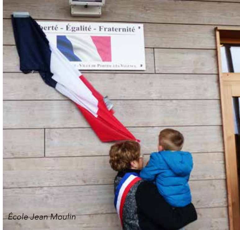
École Jean Moulin