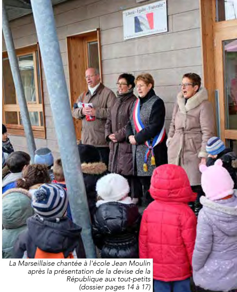
La Marseillaise chantée à l'école Jean Moulin après la présentation de la devise de la République aux tout-petits (dossier pages 14 à 17)