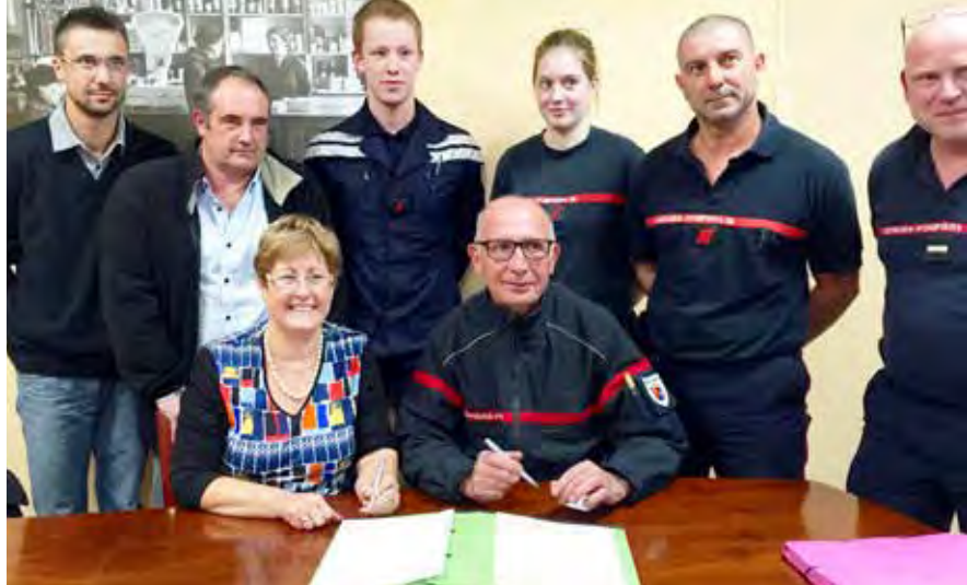
Élaboration de la contre-proposition pour la sauvegarde de la caserne, le 22 octobre 2015

Le ciel se découvre sur le centre de secours de la commune