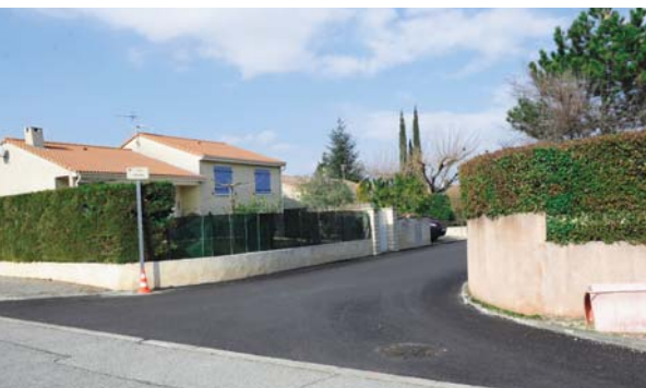
Lotissement Les Abricotines