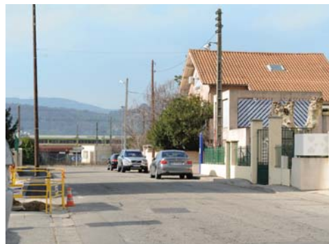
Rue Pierre Semard

Portes-Infos vous tiendra régulièrement informer des travaux en cours sur la commune.