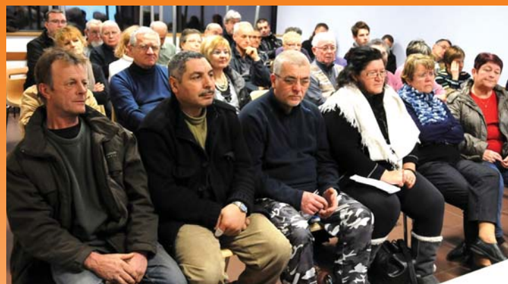
Conseil de quartier Ouest

Ces réunions publiques, synonymes d'implication citoyenne, ont également permis aux habitants de poser de nombreuses questions aux élus, notamment dans les domaines de l'aménagement des voiries, de la vitesse excessive dans certaines rues, de la sécurité, du cadre de vie et de l'environnement.