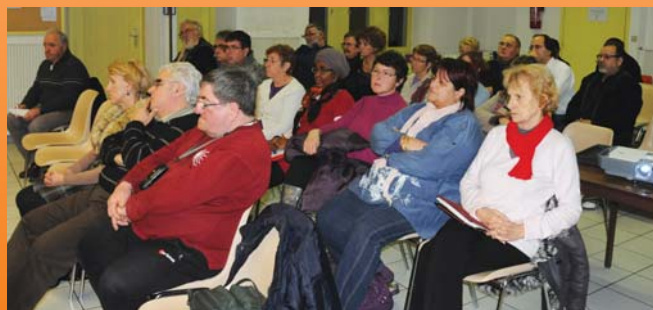
Conseil de quartier Nord