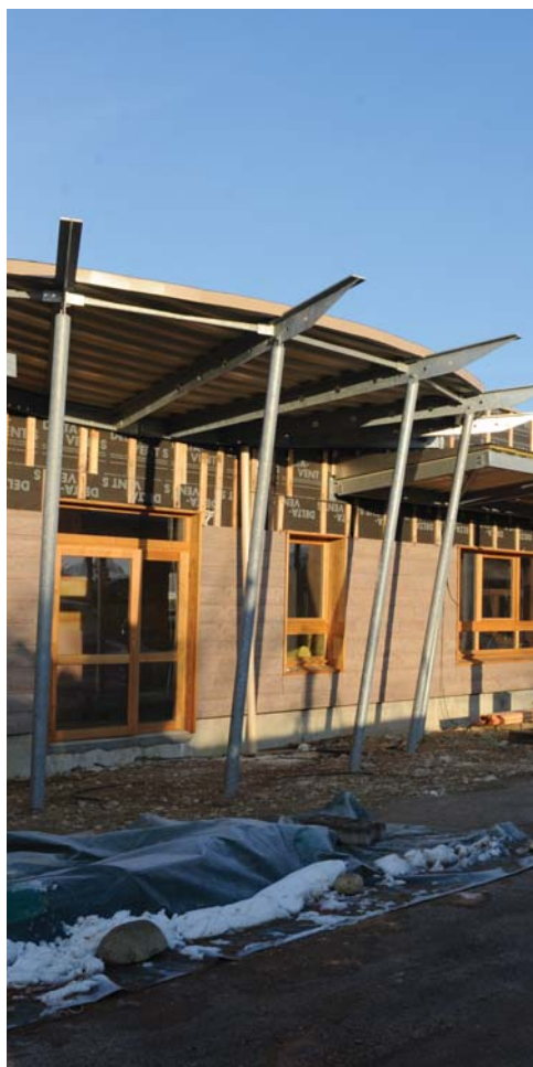
chantier de l'école maternelle Jean Moulin

Geneviève Girard, pour l'opposition municipale a pris note du fait que « la municipalité n'avait pas recours à la fiscalité sur les ménages, tout en la félicitant du niveau d'auto-financement », conséquences selon elle « des conclusions du rapport de la Cour des Comptes ».