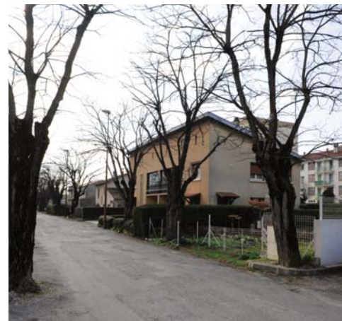
Rue Léo Lagrange

Quant aux riverains des Abricotines, la chaussée de leur lotissement "s'est refait une beauté" améliorant ainsi leur cadre de vie.