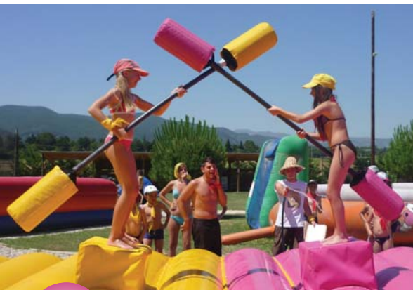
On dirait le regretté jeu "Intervilles"...