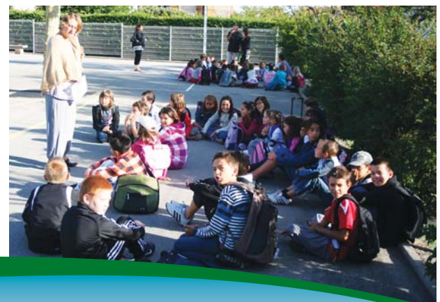
Premiers cours en extérieur

L'arrivée de l'Inspecteur départemental de la circonscription est annoncée pour 10 h 10. La cour de récré se transforme en une pièce de Beckett où l'on attend Godot, mais en vain. Il n'était pas non plus à Anatole France où l'évidence impose la création d'une quatrième classe. Car mettre 99 bambins dans 3 classes, cela relève de l'empilage de pilchards en boîte dans une sardinerie de Douarnenez ! Le maire s'y rendra également, apportant le soutien actif de la municipalité. Il faudra encore attendre 24 h et la réunion