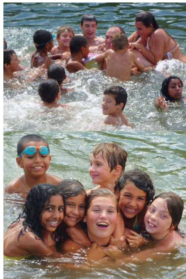
Plaisirs de l'eau sous la canicule