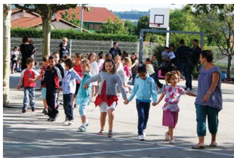
Ronde à la récré

du comité technique paritaire à l'Inspection académique le vendredi 3 septembre pour