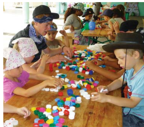
Avec des matériaux de récupération

mateur ne fait pas à sa place, il est présent, aide, oriente, suscite l'envie). En un mot, l'enfant est acteur de la vie qu'il mène au centre de loisirs. Leurs vacances, ils les construisent eux-mêmes. D'où ce temps d'expression sur les activités désirées et la réalisation de leur journée ou demi-journée. Quant aux activités, elles sont valorisées par des expos, des démonstrations, des représentations. Enfin, un moment est accordé au temps de parole du-