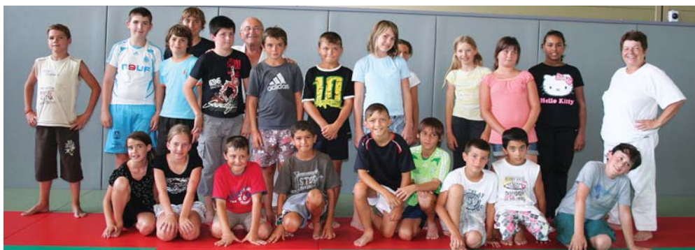
Sur le tatami pour l'initiation au judo

rant lequel l'enfant fait le bilan de la journée. En un mot, tout en respectant ses rythmes de vie, le centre de loisirs, favorisant l'apprentissage de la vie en groupe, responsabilise l'enfant et l'apprend à exercer sa citoyenneté. Parmi les activités proposées durant cette