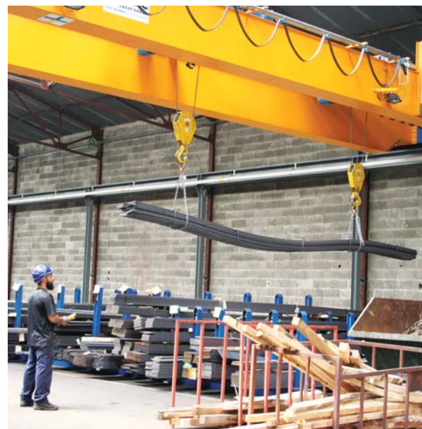
Un pont de levage de poutrelles