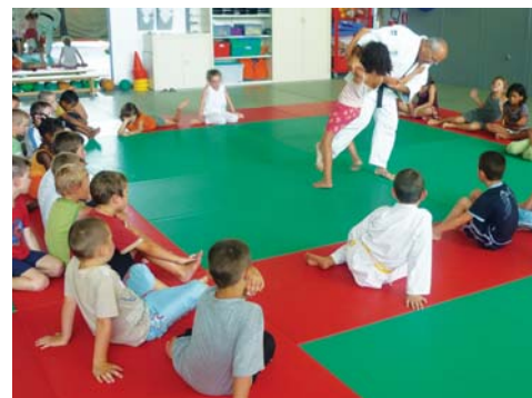
Un o-soto-gari de maître !