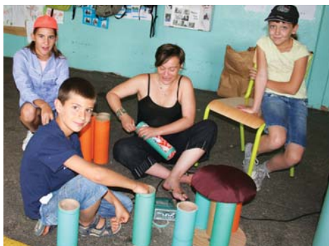
On confectionne les tabourets pour le centre de loisirs.