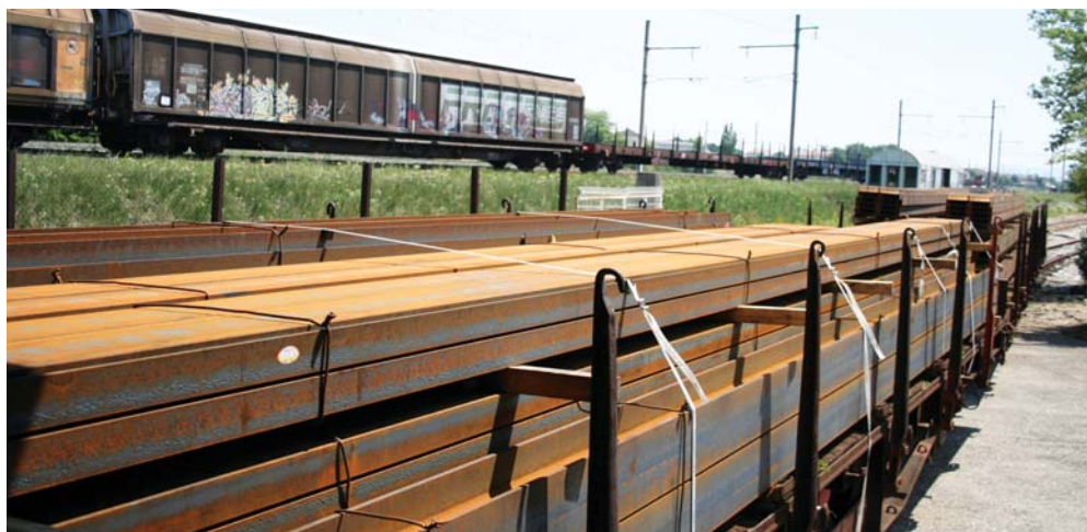
Ici, le train entre directement dans l'entreprise.

d'intervention est d'environ de 500 km et desservent 28 sites. Mais les poutres de 21 m et de 23 m ont besoin du fret ferroviaire, et donc des "wagons isolés" aujourd'hui menacés. De trois à cinq wagons isolés effectuent cette tâche de transport quotidiennement. Si ceux-ci disparaissaient, ce serait le recours obligatoire au convoi exceptionnel avec mottards. Bonjour la fluidité de la circulation ! Ce qui a pu impressionner dans cette visite, c'est justement qu'une voie de chemin de fer entre directement dans l'usine. Un peu comme une sorte de cordon ombilical... Comme le diront les responsables du site, « KDI-Merlin a joué la carte de Valence car