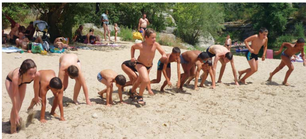
Euh ! Désolé, il y a faux départ !