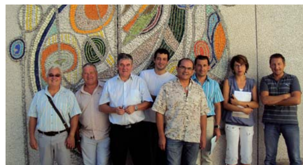
Les élus et les techniciens

pont thermique avec vitrage type 4 saisons (isolation renforcée et intelligente) avec pose de volets roulants électriques ; reprise partielle des enrobés de la cour.