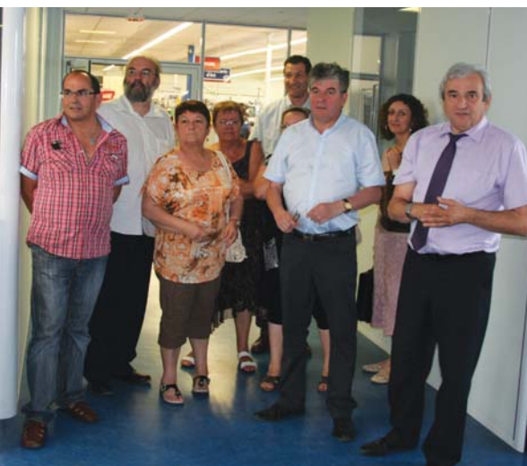
Les élus et les responsables de l'entreprise

Une entreprise qui a besoin du fret ferroviaire pour ses longues poutrelles d'acier.