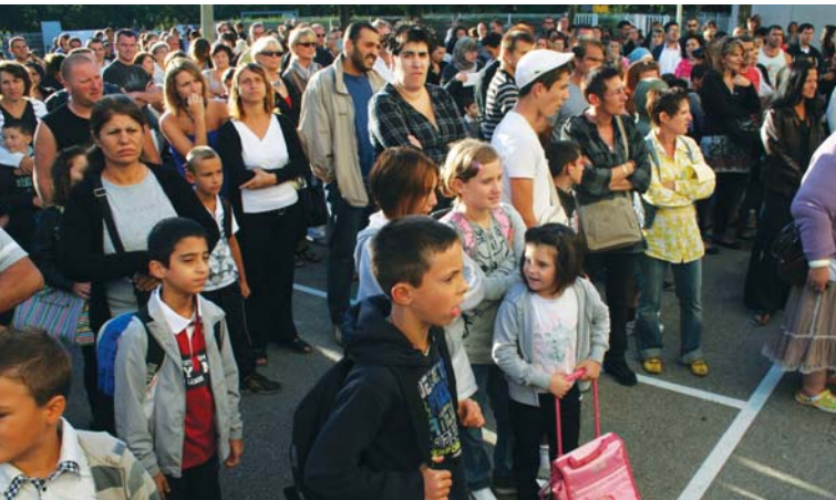
Les parents et les élèves à l'école Voltaire

Le jour de la rentrée des classes est toujours une journée particulière. Les élèves sont partagés entre nostalgie des vacances et envie de démarrer une nouvelle année. Les retrouvailles avec les camarades de classe ponctuent les premières heures de moments de joie partagée. Mais particulière, la rentrée le fut à Portes pour deux écoles, la primaire Voltaire où il s'agissait d'empêcher la fermeture de la 9 ème classe, et la maternelle Anatole France où l'évidence imposait la création d'une 4 ème classe. Dans les deux cas, la mobilisation des enseignants, des parents d'élèves et le soutien énergique de la municipalité ont permis d'obtenir gain de cause.