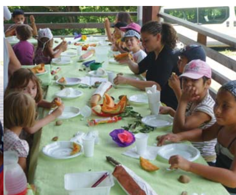
Après l'effort, le réconfort