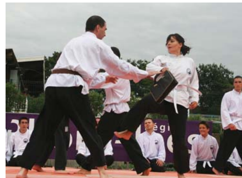
Un sport qui se pratique aussi au féminin

Le club portoais, présent à chaque forum des associations propose des démonstrations basées sur des attaques, des défenses à mains nues ou avec armes (fléau, bâton, tonfa et sabre) et des techniques de projection dont la plus spectaculaire est sans doute la prise en ciseaux par les jambes ! Le club compte aujourd'hui 56 adhérents. Au fil des ans, il s'est étoffé et est l'un des plus importants de la région.