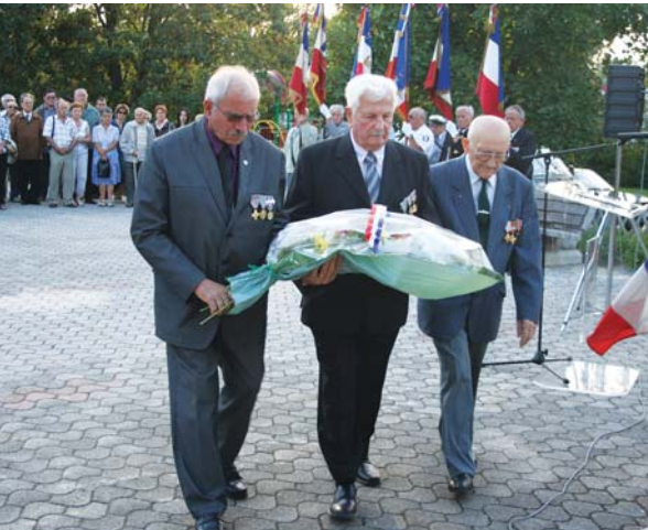
Lors du dépôt de gerbe des anciens combattants

Émouvante commémoration de la libération de la commune, le 30 août