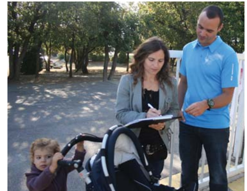
La pétition a été massivement signée